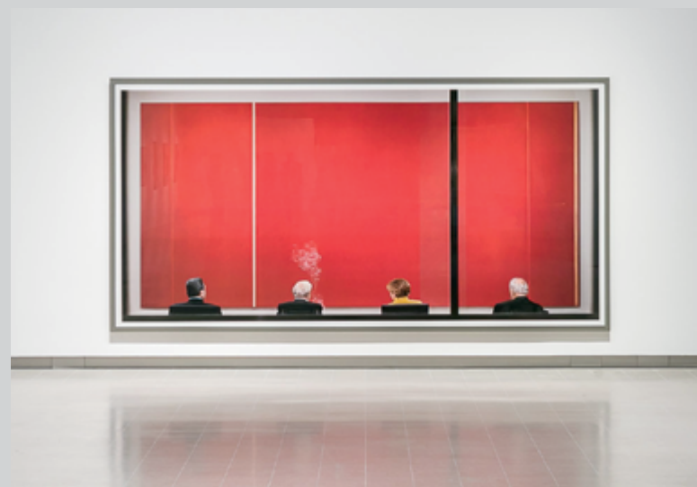
Vue d'installation à la Hayward Gallery, à Londres