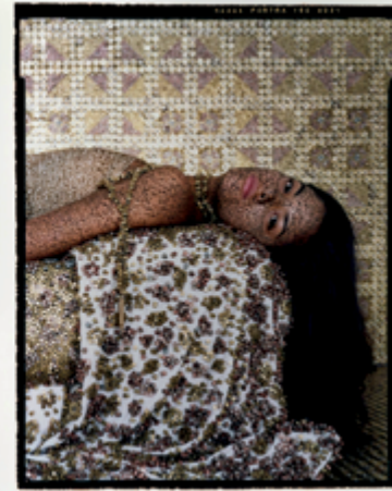
Lalla Essaydi (Marocaine, née en 1956), Bullets Revisited #3 , 2012, triptyque, impression couleur sur aluminium, permission de Miller Yezerki Gallery Boston, Edwynn Houk Gallery, New York, et du Musée des beaux-arts de Boston

des jeunes générations et s'incarne symboliquement dans ce couple assis à table sous la cible d'un char d'assaut.