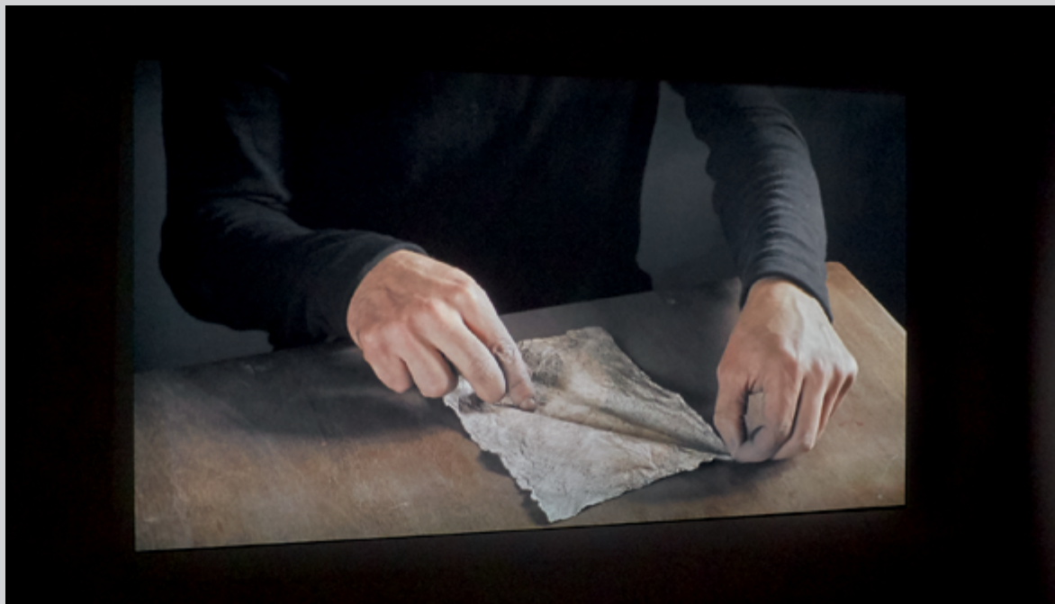
Ligne , 2011, vidéo HD 16/9, couleur, silencieux, 1 min, en boucle, permission des galeries Les Filles du Calvaire, Paris, et Selma Feriani, Londres et Tunis

La pratique d'Ismail Bahri concentre des expériences de seuil. Et la première œuvre de l'exposition en est initiatique. Ligne (2011) présente le très gros plan d'une goutte d'eau sur un poignet à travers laquelle on perçoit les légères pulsations du cœur, autrement imperceptibles. Cette œuvre délicate donne à voir la vie, sa puissance propre, qui tient à sa fragilité, son impermanence. Je pense qu'il n'est pas banal de mentionner que cette vidéo nous capte depuis l'extérieur, par la porte d'entrée qui cadre le centre de l'image. Il y a une sorte d'appel de l'image au dehors, au passage, qui n'est pas autre chose que l'expérience à vivre dès qu'on entre dans l'exposition. Si chez l'artiste la forme est inséparable de sa formation, c'est par la ligne qu'on s'y oriente : « La forme, ce qu'on appelle la forme, ou le résultat, c'est la ligne ou le "patron" qui parcourra ces points en les reliant 4 . »