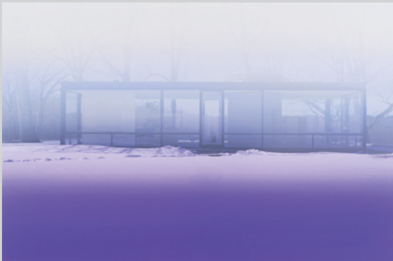
Glass House (Lavender Mist) , 2014, inkjet print (Epson 9900 print on Museo Silver Rag), 84 x 127 cm

The role that Welling plays is always that of photography student. He faithfully follows photography as if the historical body of practices were instructions that he must decipher. In this sense, we might say that photography is “imposed” on him, although he reinserts subjectivity at the point of planning his themes, topics, or subjects. His work thus demonstrates the “objectivity” of the photographic apparatus and the seeming “passivity” of the photographer, subject to contingency and accident. This, along with ambiguity as to whether abstraction or reference is dominant, leaves his work with a significant degree of vulnerability. It separates him from any account of his work as modernist – and this thread can be seen right through to Seascape ,