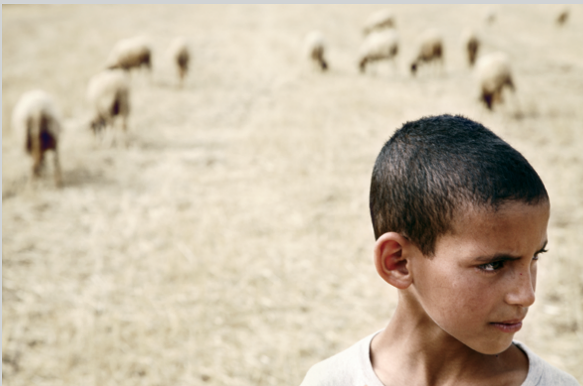
PAGES 88 ET 89 : Sans titre , de la série No Pasara [Vous ne passerez pas], 2008, impression à jet d’encre, avec l’aimable concours de la Fondation Leila Alaoui, Marrakech (Maroc) ; Galleria Continua, San Gimignano (Italie), Beijing (Chine), Les Moulins (France) et La Havane (Cuba) ; et VOICE Galerie, Marrakech (Maroc)