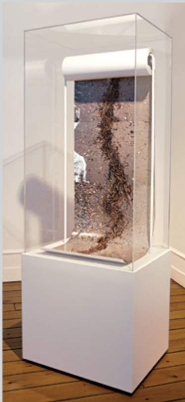
Anne-Renée Hotte, La laisse, 2016 , épreuve couleur, Plexiglas, métal et bois, 55 m

Bien que l'évènement se présente comme un ensemble d'expositions autour d'une thématique commune, modèle inventé en 1970 par les Rencontres d'Arles, il s'agit plutôt ici d'une vaste exposition collective dont les propositions individuelles sont disséminées entre le Centre d'art de Kamouraska et dix municipalités de la région. Au contraire