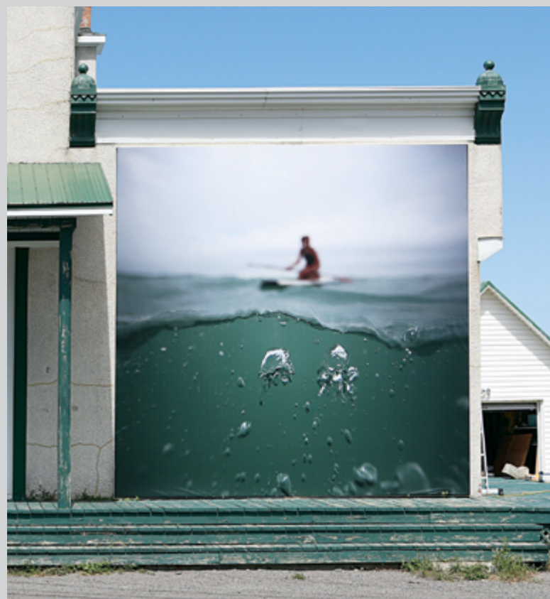
Isabelle Hayeur, Remous , 2016, de la série Underworlds , impression au jet d'encre sur bâche, 4 x 4 m

Les œuvres d'Emmanuelle Léonard sont plus à l'affût des changements et de la succession des générations. Suivant la pratique qu'on lui connaît, qui s'inspire du documentaire, mais qui joue parfois de façon incongrue sur les principes de sélection des images comme si elle pointait vers autre chose que ce qui est dit et que ce qui semble faire l'objet de l'étude filmique, Emmanuelle Léonard saisit les gens dans leur environnement familier et les interroge subtilement, sans façons, mais efficacement et non sans laisser place à des silences qu'une pratique documentaire traditionnelle