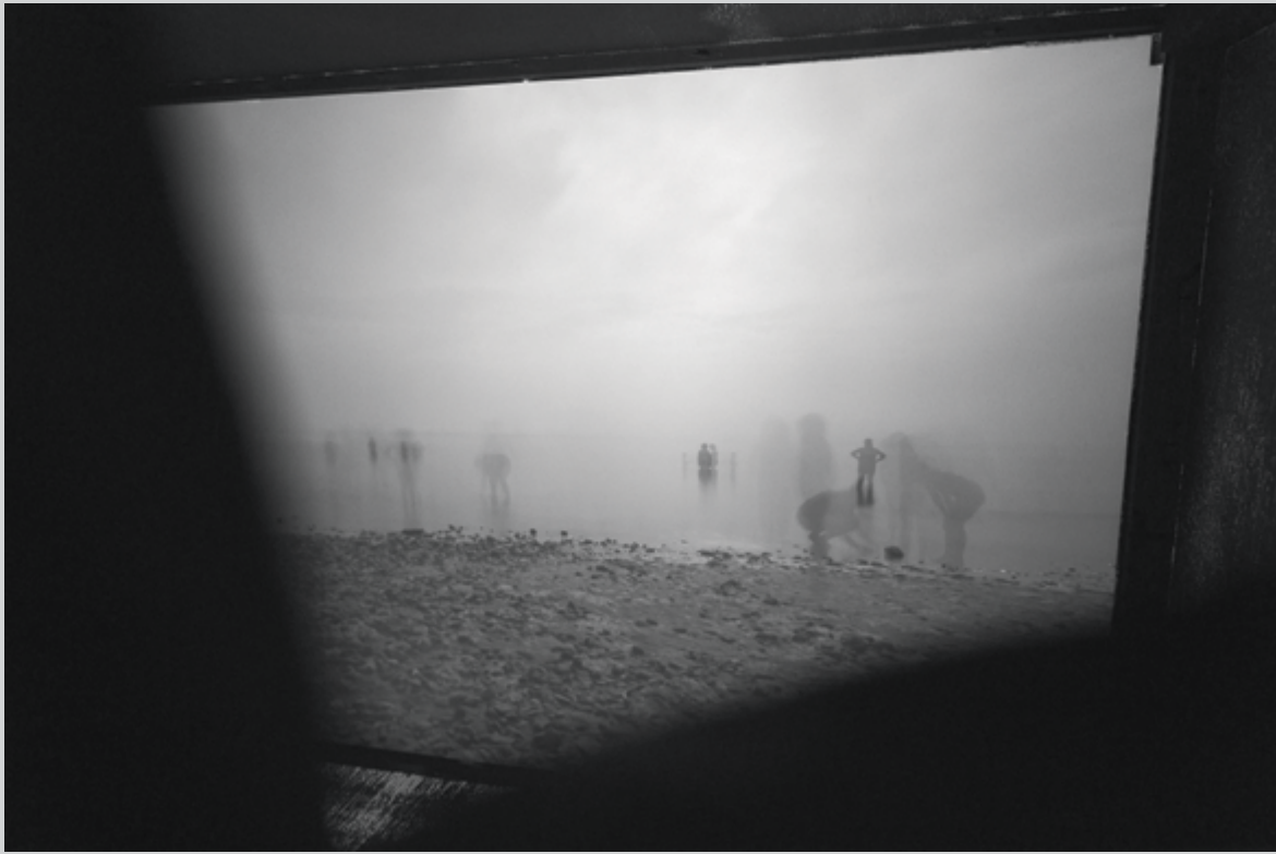
Steve Leroux, Projection 10, Fin de journée à la plage, Bonaventure, 2014 , projection, 81 × 122 cm