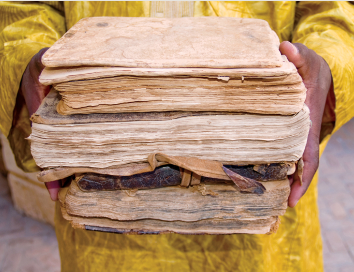
Seydou Camara Manuscrits de Tombouctou 2009

sa terrasse de papiers peints photographiques. Il semblerait que pour cette édition, le pari ait été poussé encore plus loin. Et c'était totalement réussi.