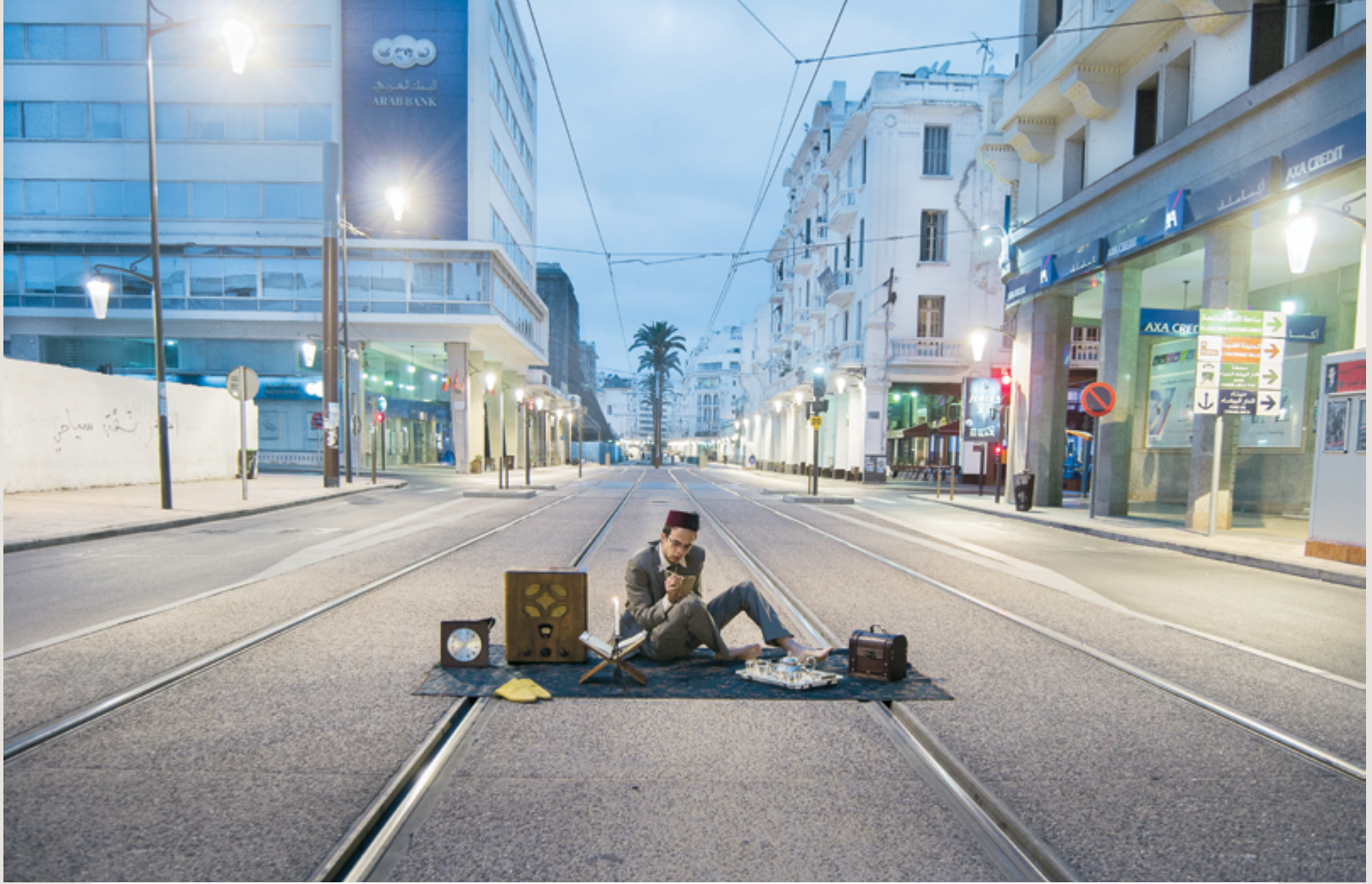
Youssef Lahrichi Le nostalgique 2014