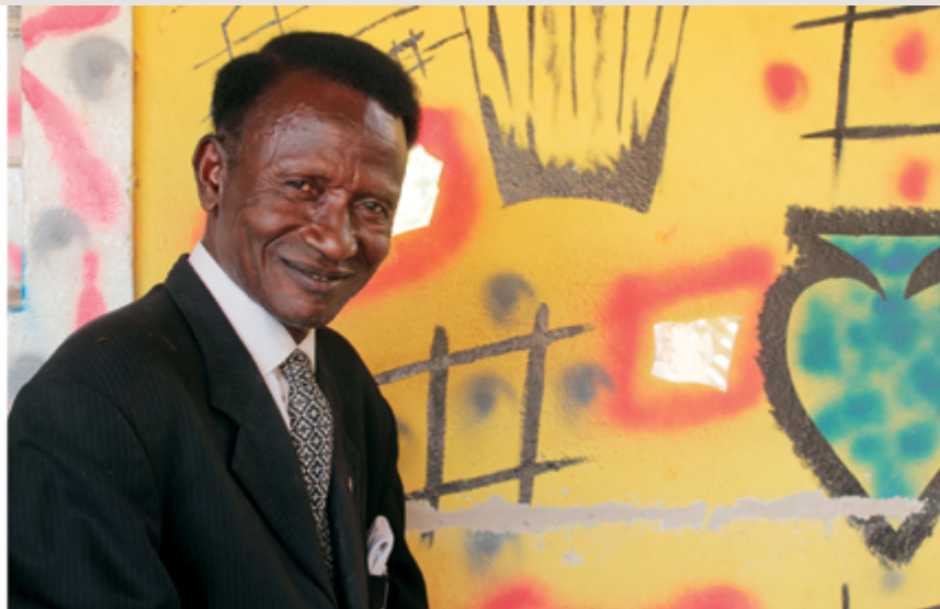
Georges Sengo Une vie après la mort 2012, diptyque/diptych

(Afrique du Sud), Prix du jury, ex-æquo avec la photographe Lebohng Kganye, et d'Em'kal Eyongakpa (Cameroun) qui s'est vu décerner la bourse Tierney pour son installation Be-side(s) , collage hybride de vidéo-performance, dessins, photographies et poèmes. Cette présence grandissante de la vidéo révèle toutefois une faille majeure sur le plan logistique : le manque d'expertise, mais encore plus celui d'infrastructures adéquates pour présenter dans de bonnes conditions des œuvres multimédias.