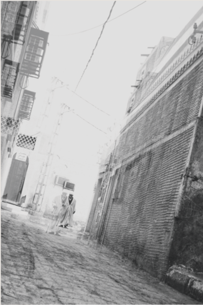
Lola Khalifa Éphémère (sans titre 3) 2013