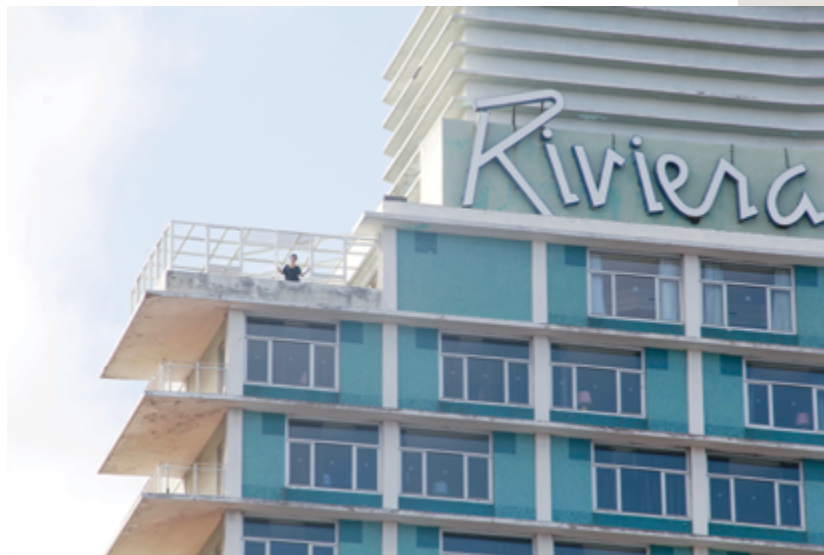
Coco Fusco La confesión 2015, vidéo/video, 30 min