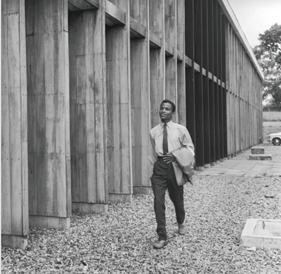
J. D. 'Okhai Ojeikere Untitled (WNTV 010) 1962

Sites Web / Websites: http://www.rencontres-bamako.com/ http://www.institutfrancais.com/fr/actualites/rencontres-de-bamako