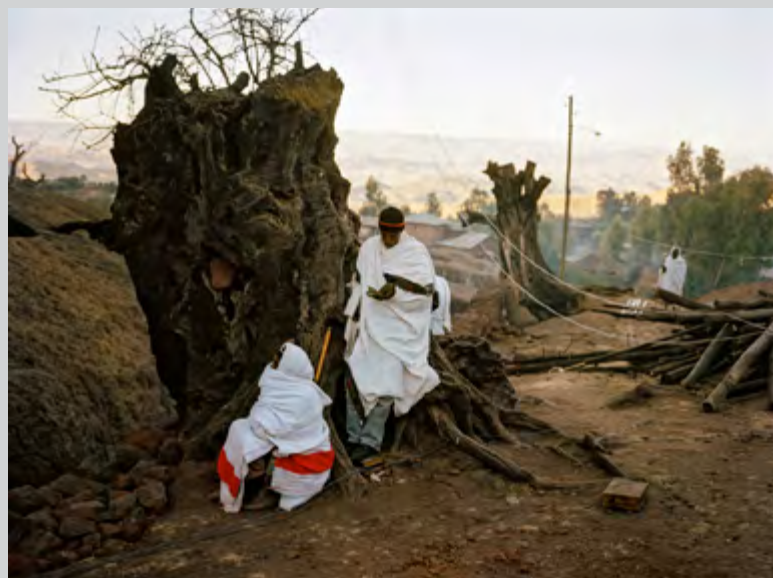
Lalibela, Éthiopie, 2013, 170 x 227 cm

Sur le mur opposé, des images de très grand format leur font face. Réalisées en Afrique, aux États-Unis, en Amérique du Sud, à Honolulu et en France, la plupart de ces photographies sont empreintes d'une force paisible, loin de tout sensationnalisme. Dans le regard de Depardon, encore émerveillé après avoir fait plusieurs fois le tour de la planète, après avoir photographié la faim, la soif, la misère, les conflits armés, les oubliés de ce monde, on sent une certaine sérénité et un besoin de calme, d'ailleurs confirmés par le titre de l'exposition : Un moment si doux . Cette quiétude se retrouve de manière éloquente dans cette image de deux hommes drapés de blanc, assis sur les racines du tronc d'un arbre immense dans la lumière dorée d'une fin d'après-midi dans le désert. Ils ne font rien, n'attendent rien. Seule la lumière décline. Dans une autre, une jeune fille