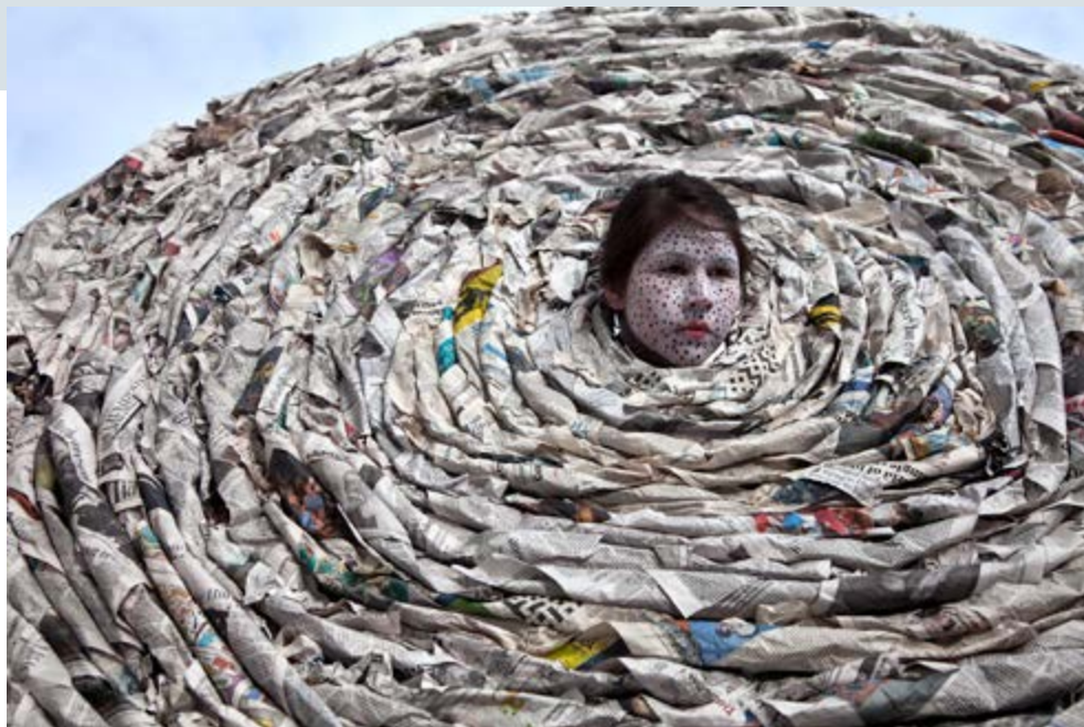
Meryl McMaster, Aphoristic Currents , 2013

young artist showed interdisciplinary skill in ten large chromogenic photographs of her performance installations, making poetic statements about colonized indigenous bodies and cultures. In Terra Cognitum , draped circles of strung beads demarcate regions on the artist's prone body that suggest topographic map markings. In Winged Calling , McMaster, dressed as a raven laden with small birds, moves through a snowy landscape. This artist's occupation and manipulation of the space of the other is more complex than Salgado's pure peoples and places.