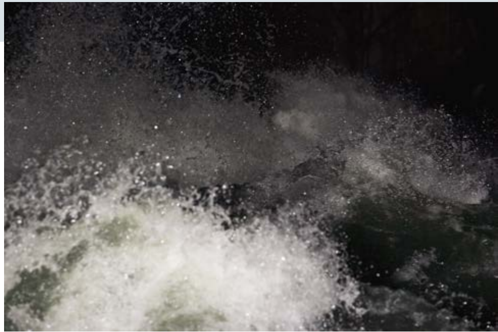
Andrew Wright, Nox Borealis , 2012, c-print / épreuve chromogénique; Standing Wave #6 , 2007, chromira light jet print / impression jet de lumière chromira, collection of / de Museum London

startling details in two giant negative prints, produced when Wright turned the gallery's spaces into camera obscurae, are more magical due to their reversed tones, suggesting the primitive thrill that viewers of this optical phenomenon experienced centuries ago ( When Buildings Take Pictures of Themselves , 2013). The camera obscura images in Skies (2003–04) are random frames of captured clouds passing overhead, taking us back to the times of William Henry Fox Talbot's The Pencil of Nature , when photography was understood as "nature writing itself." After Kurelek (2013) is a stunning Arctic panorama inspired by the painter William Kurelek's depiction of white snow. A stark white mountain cut sharply against black Arctic sky becomes abstract when presented upside down. The artist's playful tinkering with diverse media is encapsulated by a group of five mixed-media pieces that revolve around the depiction of clouds. What appears to be a historical photogenic drawing was produced with an iPhone app; the "cloud" in a wet-plate collodion image was sculpted from a crumpled paper towel.