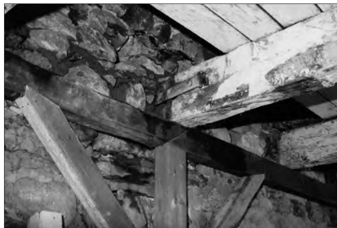
Avec le temps, les extrémités des poutres se dégradent au contact de la maçonnerie. Diverses solutions permettent de pallier ce problème.

Dans les combles, on observera la charpente et la toiture afin de