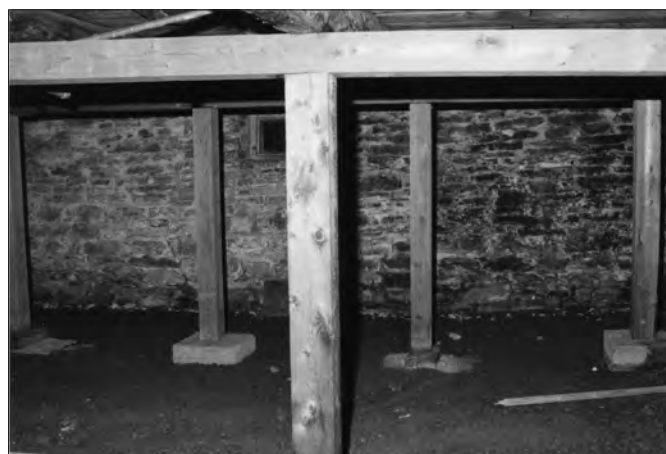
Lorsque le plancher s'affaisse, un des trois types d'interventions à envisager consiste à soutenir les solives défectueuses au moyen de poteaux reposant au sol sur des bases de béton carrées stables.