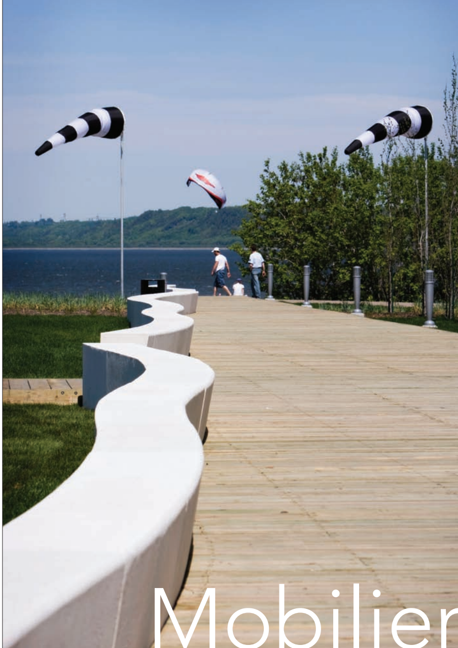
Ci-contre, un banc-vague et des indicateurs de vent sous l'emprise de la lumière et de la brise à la Baie de Beauport