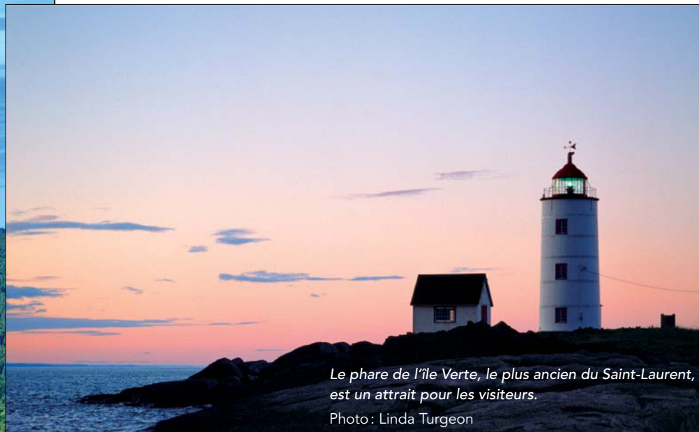
Le phare de l'île Verte, le plus ancien du Saint-Laurent, est un attrait pour les visiteurs.

Comment assurer une évolution harmonieuse entre le paysage issu d'une écono-