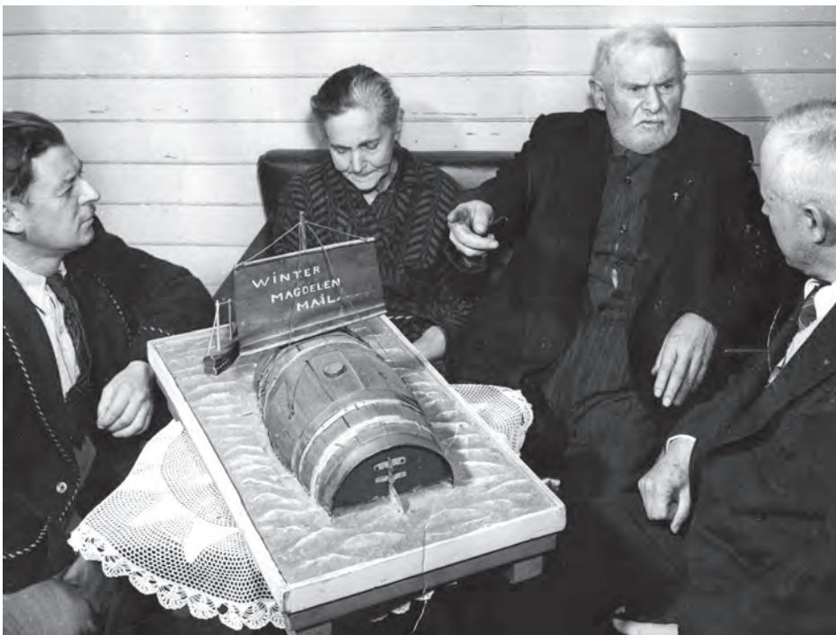
Commémoration en 1947 de l'aventure du ponchon Source : Musée de la mer, P2019.011

Suivant le souhait formulé par le Musée de la mer, l'équipe de l'atelier des œuvres sur papier avait comme mandat de restaurer le document afin de le rendre à nouveau accessible au public.