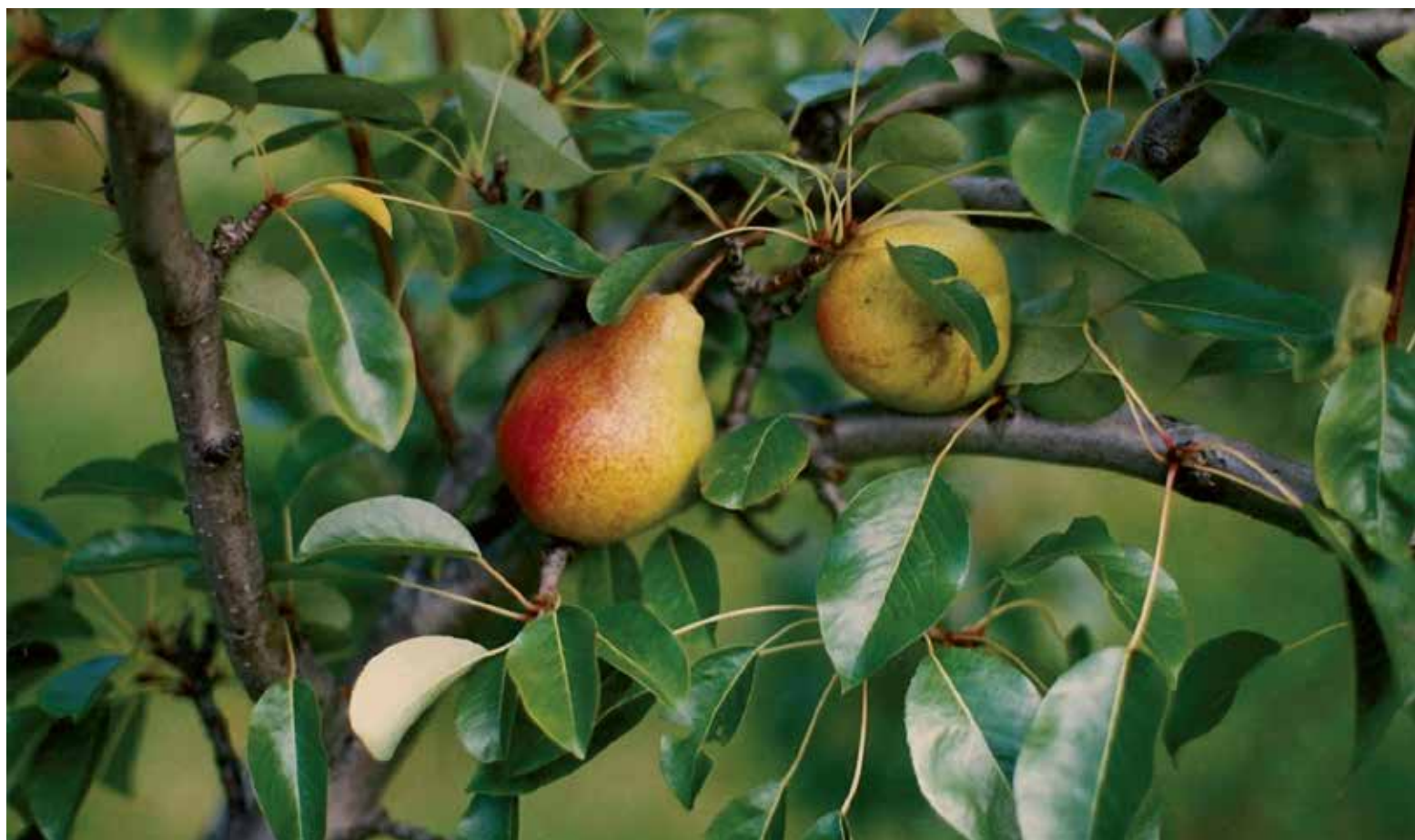
La poire Beauté flamande, venue de Belgique, a été introduite à Boston en 1834.