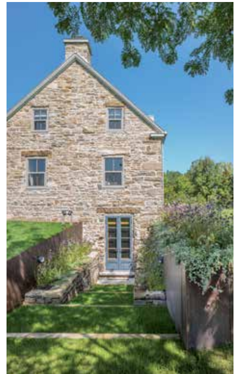
L'accès au sous-sol a été réaménagé avec de nouveaux murs de soutènement en acier Corten.

même matériau, ils s'inscrivent en continuité avec l'agrandissement de la maison datant de 1996, laquelle conserve sa fonction d'origine.