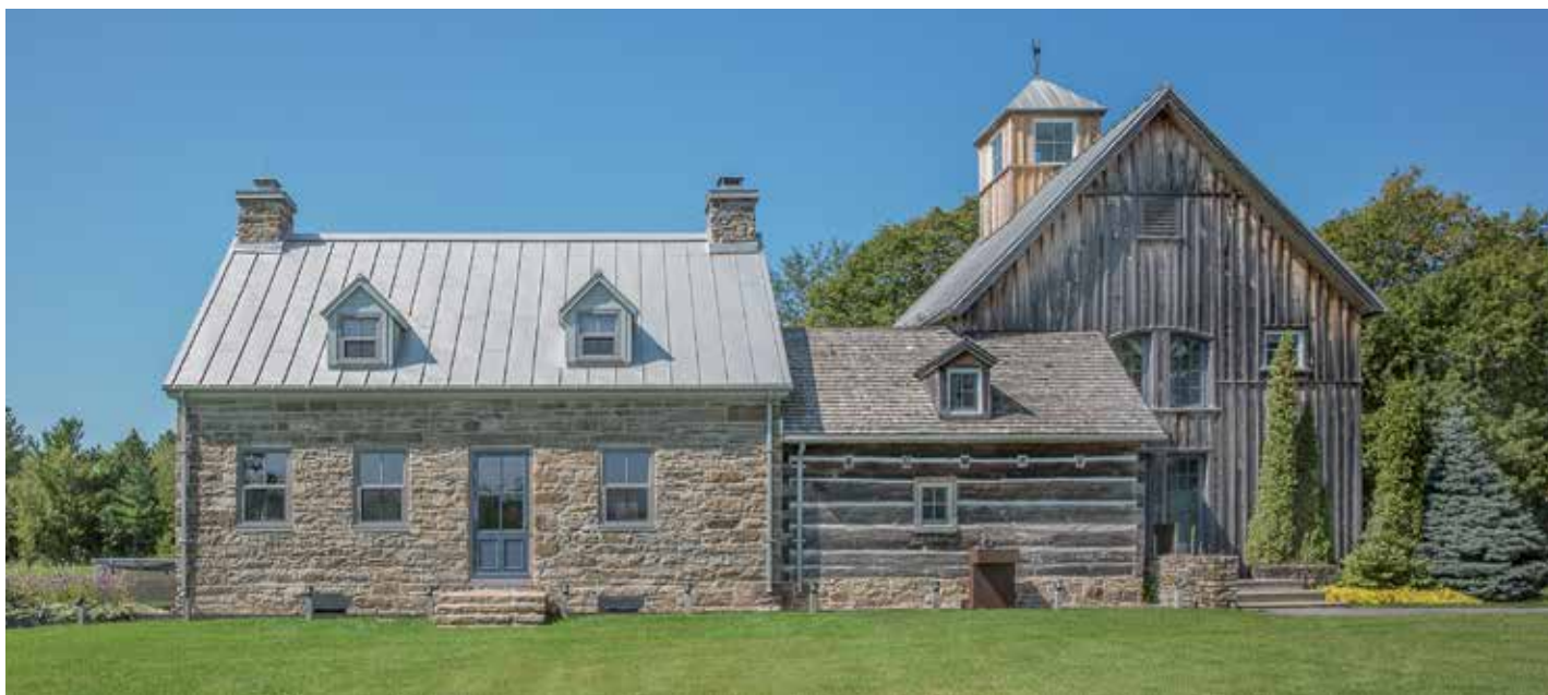
Ensemble de la maison de ferme intégrant la maison ancestrale en pierre des champs, le corps bâti en pièce sur pièce et l'ajout avec son revêtement de planches à couvre-joint.

La clé de la réussite de ce projet ? L'étroite collaboration d'EVOQ Architecture avec des artisans expérimentés à toutes les étapes du processus, de l'analyse à la réalisation en passant par la conception.