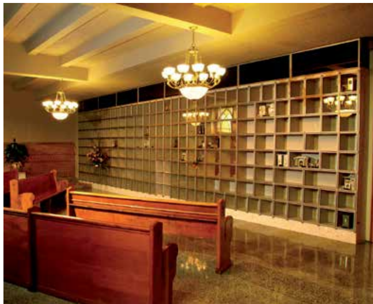
Menacée de fermeture il y a quelques années, l'église Saint-Joseph à Drummondville poursuit ses activités grâce à l'aménagement, dans son enceinte, d'un salon funéraire avec columbarium.

Cette meilleure adaptation pourrait même contribuer à la conservation des églises patrimoniales en péril si on y aménageait des columbariums, avance-t-il. « Il n'est pas question d'encombrer les églises avec des morts, mais j'ai suggéré de prévoir des fonctions funéraires dans l'église Saint-Eusèbe-de-Vergeil du quartier Centre-Sud, à Montréal. Elle est menacée de démolition. L'endroit pourrait être partagé avec des organismes communautaires qui en assureraient la surveillance. Ça