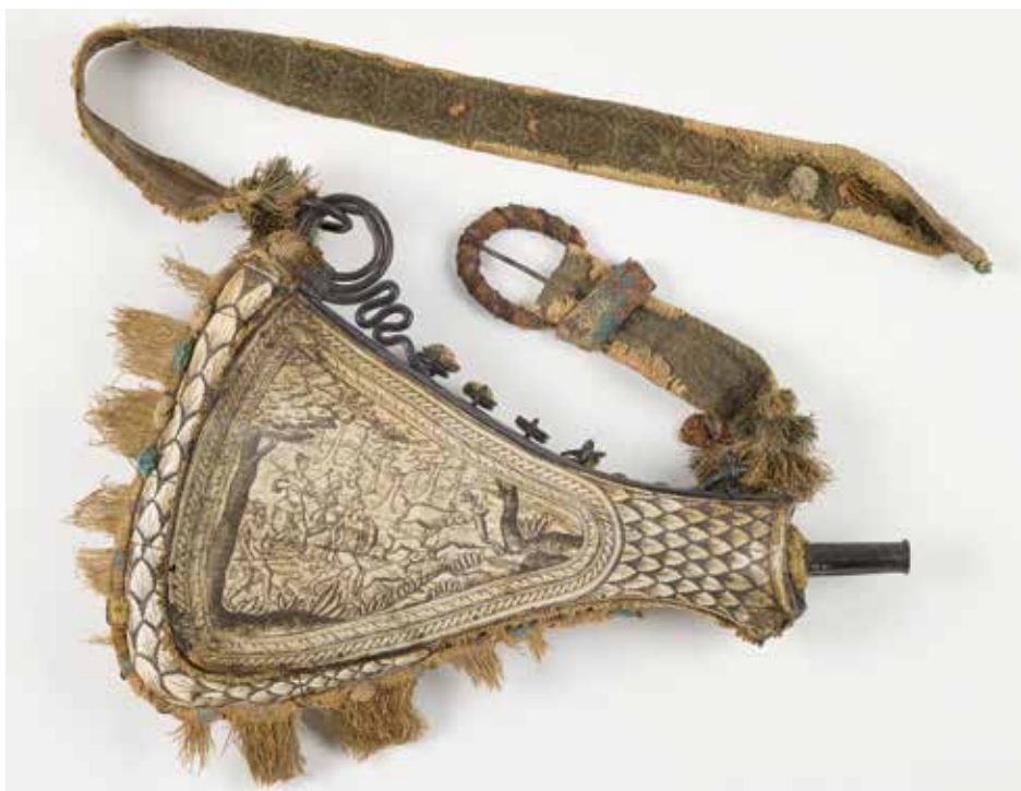
La poire à poudre de chasse du Musée Stewart a une histoire fascinante à raconter, même si ce n'est pas celle qu'on croyait...