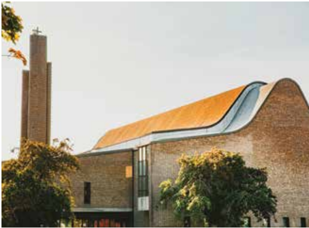
Dans le cas de l'église Saint-Gérard-Majella, la diffusion d'information sur la valeur patrimoniale du bâtiment a suscité une mobilisation citoyenne et permis d'éviter la démolition.

À l'échelle internationale, le Québec est présenté comme un exemple à suivre en matière de concertation avec la communauté.