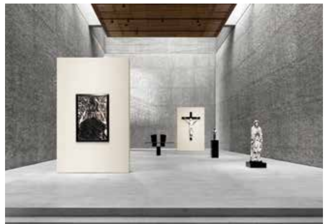
Un peu partout dans le monde, les lieux de culte modernes cherchent de nouvelles vocations. À Berlin, l'église Sainte-Agnès a été reconvertie en galerie d'art contemporain. Ici, l'exposition The Others , organisée par les commissaires Elmgreen & Dragset.

Mais en sortant de l'ombre, les églises modernes pourront peut-être quitter les rangs des négligés et des mal-aimés. ♦