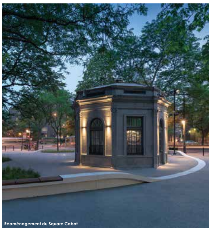
Réaménagement du Square Cabot