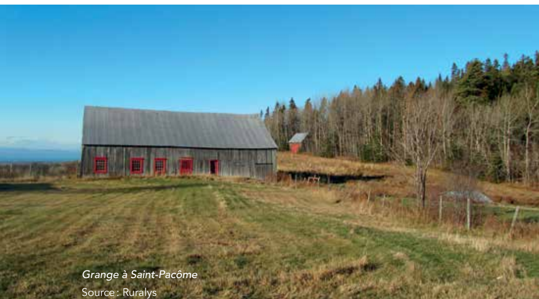
Grange à Saint-Pacôme