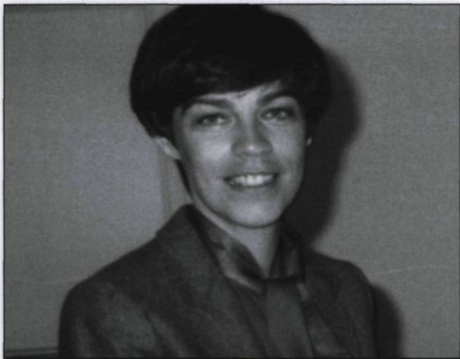
Louise Beaudoin, historienne, députée, ministre et déléguée générale du Québec à Paris en 1984-1985.