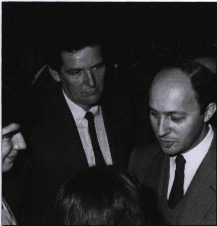
Renaud Vignal, consul général de France de septembre 1983 à mars 1987, en compagnie de Laurent Fabius, premier ministre de France. Photographie 1984.

frappé par la transformation du Québec en une génération, depuis les années où se conjugaient Révolution tranquille, ouverture au monde et débat sur la souveraineté. Une nouvelle configuration se dessine avec la disparition du « carcan protecteur de l'Église catholique », le démenti récent du projet de l'indépendance et « l'absence de dessein collectif », dit-il, la réapparition de la question linguistique, dans un contexte marqué par les conséquences de l'urbanisation et la baisse du taux de natalité.