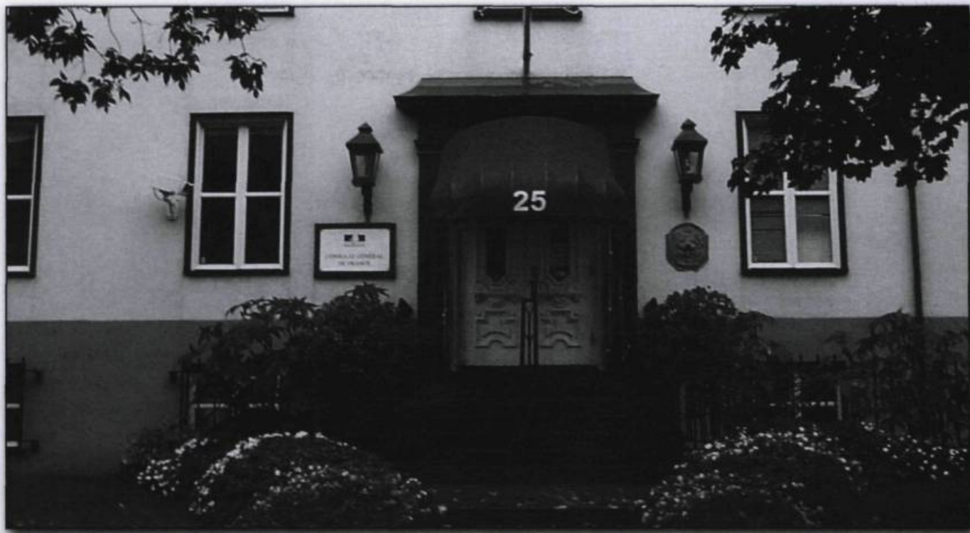
Façade du consulat général de France, rue Saint-Louis à Québec. (Archives privées).