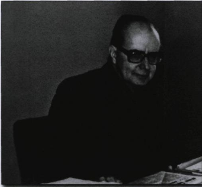
■ Maurice Séguin est né en 1918 à Horse Creek en Saskatchewan et il est décédé en 1984. Historien, il fit carrière à l'Université de Montréal.

C'est pourquoi la Conquête apparaît aux historiens de l'École de Montréal comme l'événement central de l'histoire des Canadiens français. Elle permet, selon eux, d'expliquer l'origine de leur infériorité économique et des divers retards qu'ils ont accumulés comparativement aux autres sociétés occidentales de l'époque, tout en ruinant ses chances de devenir un jour une nation autonome. Même la tradition nationaliste dominante et l'interprétation du passé qui l'accompagne leur apparaissent comme le signe d'une aliénation collective profonde et subtile qui découle des conséquences de cet événement. En somme, non seulement la Conquête est une épreuve qui n'a pas été surmontée, mais ses conséquences diversifiées se font toujours ressentir dans le présent, même dans la conscience nationale.