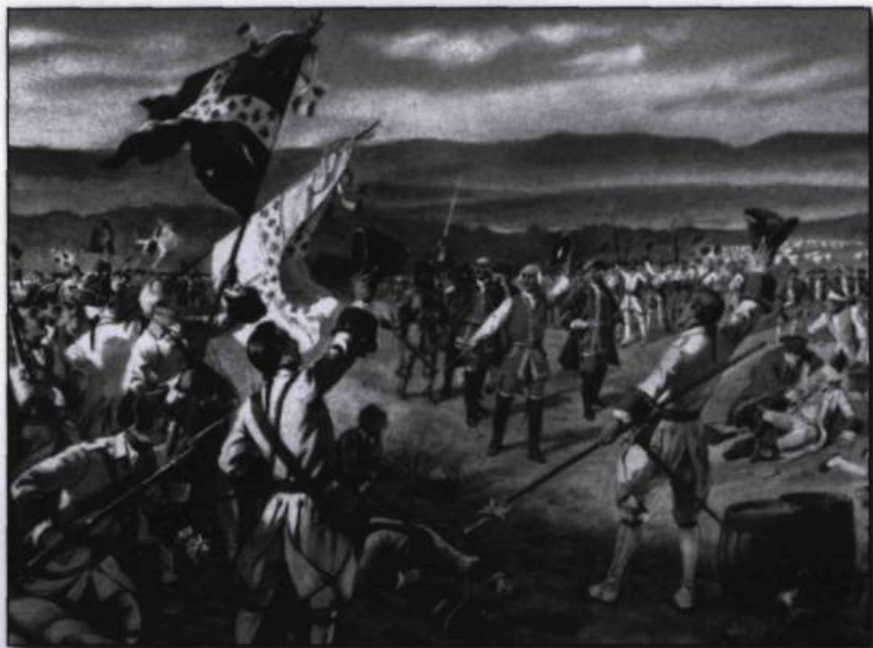
Carte postale Genuine Curteich-Chicago, vers 1965. (Coll. Yves Beauregard).

seulement avaient pu être mis à eau. De plus, les effectifs vieillissants, l'administration sclérosée et le népotisme omniprésent freinaient considérablement l'armement des navires de guerre français.