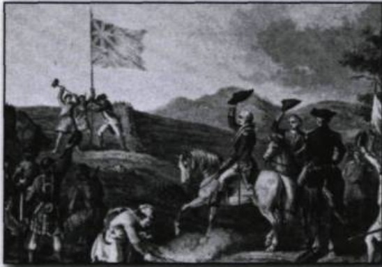
Ces deux gravures illustrent en haut la prise du fort Frontenac (août 1758) sur la rivière Cataragui (Kingston aujourd'hui) et en bas la prise du fort Duquesne (novembre 1758) sur la rivière Monongahela (Pittsburgh, Pennsylvanie aujourd'hui).

souvent à intercepter les convois avant leur arrivée à Québec. Un événement tragique, indépendant de la guerre, affaiblit encore la marine française : en 1757, l'escadre d'Emmanuel-Auguste Dubois de