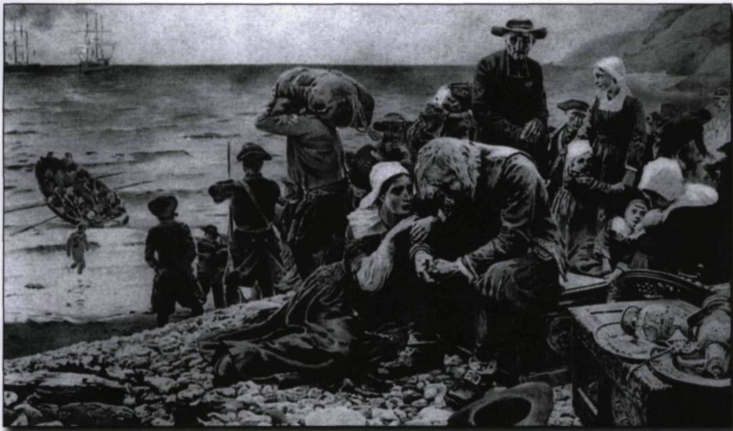
■ Déportation des Acadiens par les Britanniques, en 1755. Carte postale Ern. Thill, Bruxelles, sans date.