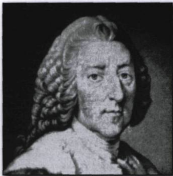
William Pitt (1709-1778) est l'âme dirigeante du cabinet du duc de Newcastle. Secrétaire d'État depuis 1756, il dirige la participation de son pays dans la guerre de Sept Ans.

Pour la France, l'Amérique n'était qu'une partie du front qu'elle voulait et devait défendre. Mais, hors de l'Europe, c'était le plus convoité. Surtout quand le premier ministre William Pitt reprit les commandes en Angleterre, en 1757, avec l'objectif principal de s'approprier l'empire colonial français. Il y consacra des ressources fabuleuses, envoyant des troupes, du matériel militaire, du ravitaillement de toute nature. L'atout principal de l'Angleterre était sa flotte de 107 gros navires de guerre qui lui permettait de mener une impitoyable guerre de course sur l'Atlantique. Avec sa cinquantaine de vaisseaux, la France faisait piètre figure sur les mers. Le ministre de la Marine avait relancé la construction navale depuis 1748, mais il manquait de bois d'œuvre et une quinzaine de vaisseaux