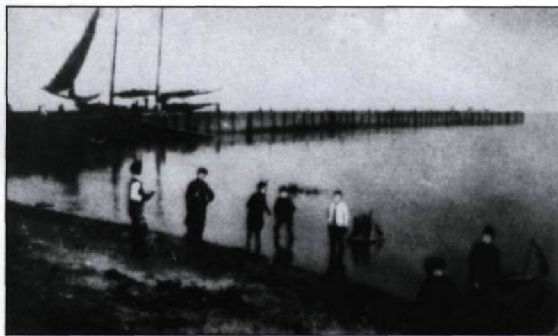
Vue du quai de Kamouraska au tournant du siècle. (Carte postale vers 1910, collection privée).

des années 1920, la motorisation de la majorité des goélettes. La goélette E.C. , l'ancienne Julie du capitaine Euclide Chouinard de Saint-Jean-Port-Joli est l'un des premiers navires de la Côte à recevoir un moteur en 1925. Même s'il poursuit son évolution architecturale avec la motorisation, ce type de navire en bois est toujours construit de manière artisanale, c'est-à-dire fabriqué à partir des techniques traditionnelles transmises d'une génération à l'autre par le geste et la parole.