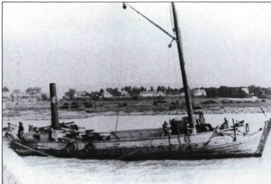
La goélette «E.C.» du capitaine Euclide Chouinard, vers 1925. Exemple typique des premières goélettes motorisées. (Collection Alain Franck).