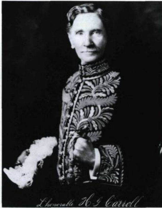
Henry George Carroll, homme politique anglophone né à Saint-Louis-de-Kamouraska en janvier 1865.