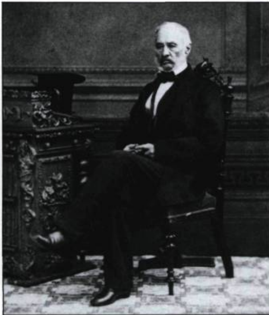
Philippe Aubert de Gaspé (1786-1871)