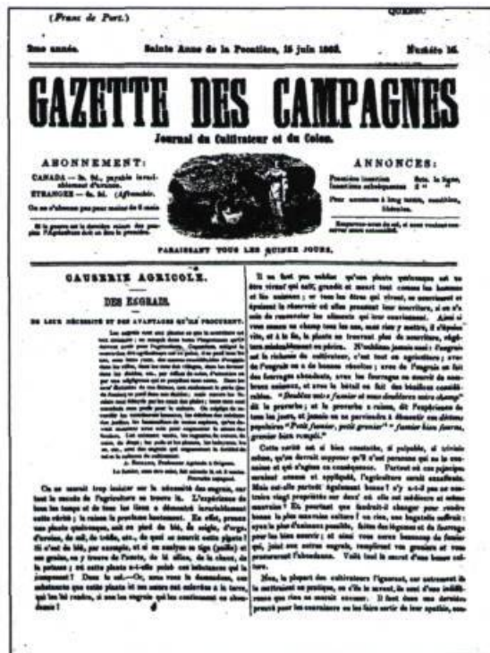
Page frontispice de la Gazette des campagnes (15 juin 1863). Né en septembre 1861, cet hebdomadaire renseignait et défendait la classe agricole. Il s'éteint en mars 1895.

Pour stimuler les élèves et les inciter à prendre leurs études au sérieux, la corporation de l'institution créée, en 1870, trois «sociétés littéraires»: l'Académie Saint-Thomas d'Aquin (cours classique) et l'Académie Saint-Louis de Gonzague (cours commercial) engagent leurs membres à bien se comporter et à travailler fort en classe. Chaque élève est admissible à l'académie de son cours s'il répond aux exigences demandées (succès scolaire). Les membres des deux sociétés sont tenus à donner annuellement deux séances publiques (lectures, exposés, débats, et autres activités). Ils peuvent aussi présenter une séance privée par mois. La troisième société, la Société Painchaud, veut instruire en amusant. Elle regroupe des étudiants qui discutent de leurs travaux, parlent de philosophie, d'histoire, de sciences et de littérature.