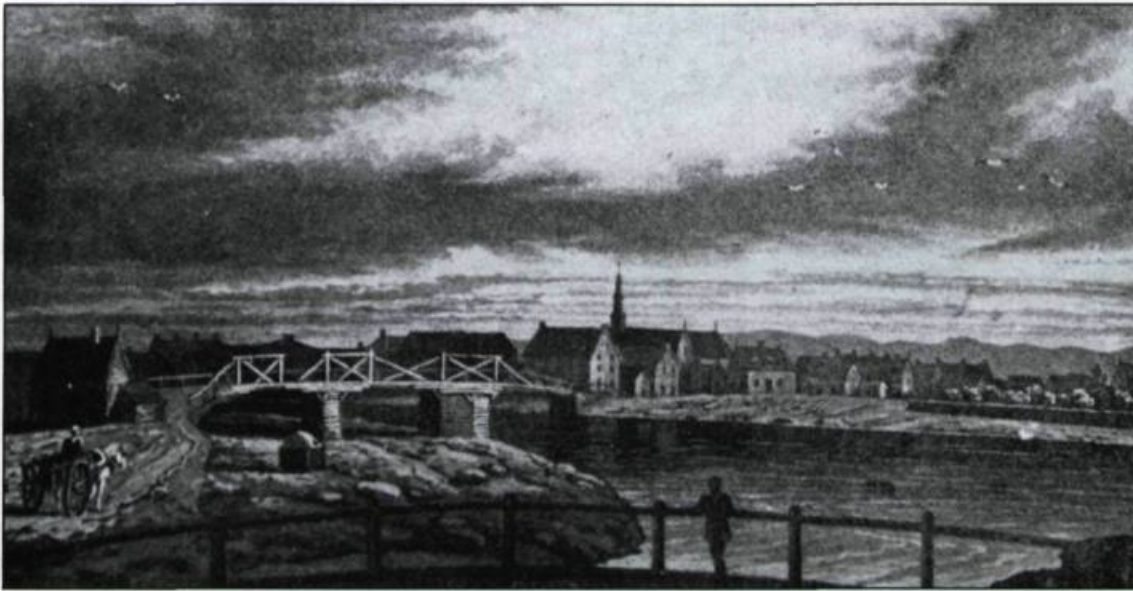
Le village de Montmagny au début du XIX ème siècle.

villageois; d'autre part, les seigneuries de la Côte-du-Sud se trouvent relativement saturées. Selon l'arpenteur Joseph Bouchette, qui parcourt la région au début du XIX ème siècle, il reste bien peu de nouvelles terres à concéder dans la zone seigneuriale.