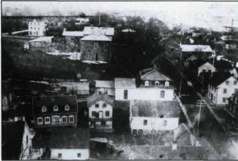
Vue du village de Saint-Joseph-de-Beauce, au début du XXI ème siècle. (Archives nationales du Québec).

habitants à développer une économie autarcique fondée sur le troc et l'entraide. De la lutte contre les rigueurs climatiques et de l'isolement naissent la tradition des corvées, l'habitude des Beaucerons de se faire justice eux-mêmes, de se débrouiller seuls et de s'identifier d'abord à la région, plutôt qu'à la province ou au pays. Les crues répétées de la Chaudière, qui l'ont rendue célèbre car elles emportaient souvent tout sur leurs passages: maisons, granges, bestiaux et ponts, vont renforcer l'habitude de se serrer collectivement les coudes face aux défis. Le dynamisme économique, qui fait citer la Beauce en exemple, puise ses sources dans ces formes d'entraide et de solidarité.