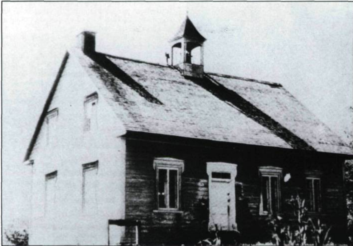
École de rang de Grondines dans le comté de Portneuf. (Jacques Dorion, Les écoles de rang au Québec, Montréal, 1979, p. 151).