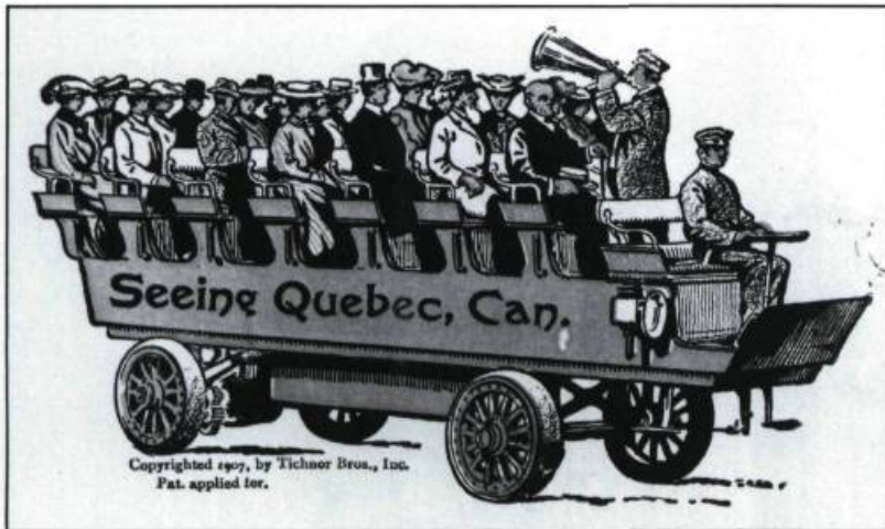
Char observatoire tel que l'on en voyait sur la rue Saint-Jean. (Carte postale, collection Yves Beauregard).

coins de rues, le tout gagnant ensuite le fleuve par un réseau de tuyaux souterrains.