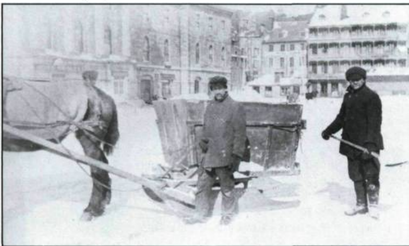
Photographie illustrant les banneaux utilisés pour ramasser la neige. (Carte postale, collection Yves Beauregard).

Dans certaines rues moins prioritaires, la neige s'accumulait sur place et un rouleau compresseur, lourdement chargé et tiré par des chevaux, tassait la neige, permettant aux voitures à traction animale de circuler en surface. Le printemps, cependant, les choses se compliquaient un peu! La rue Sainte-Claire devenait pour nous un terrain de jeux. Nous faisons parfois de joyeuses glissades en traîne ou en traîneau depuis la rue Saint-Jean jusqu'à la rue Saint-Réal, près de l'escalier de fer et la falaise surplombant la partie basse de la ville.