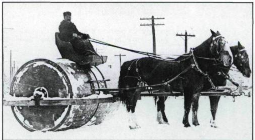
Rouleau avec lequel on foulait la neige. (Collection privée).

Dans son livre Ils se sont connus à Llow , Alice Parizeau pose la question suivante: « Existe-t-il vraiment un pays au monde où il n'y a pas de poux? » A ma connaissance, il s'en trouve partout des poux; ils constituent un fléau universellement connu. Une autre phrase tirée du même livre décrit bien ce que ceux de ma génération ont ressenti au contact de ces êtres détestables qui ont hanté notre jeunesse: « Il me semble, dit l'auteure, que les poux sont partout, dans ses cheveux, sur son corps et dans chaque repli de sa peau. Elle ne cesse de se gratter, d'avoir mal et de se tourner d'un côté à l'autre en essayant de s'endormir. »