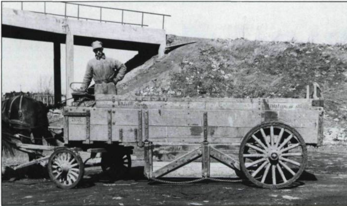
Véhicule servant à la cueillette des ordures accumulées durant l'hiver dans les arrières-cours.

rhume persistait, on nous appliquait une « mouche » ou couche de moutarde étendue sur un papier brun et placée soit sur la poitrine ou sur le dos, ce qui constituait une sorte de cataplasme efficace. Parfois, on nous badigeonnait le haut du corps avec de la teinture d'iode forte et nous changions ainsi de peau à quelques reprises durant l'hiver. Cette iode avait comme effet de faire sécher l'épiderme qui se détachait ensuite en fins lambeaux.