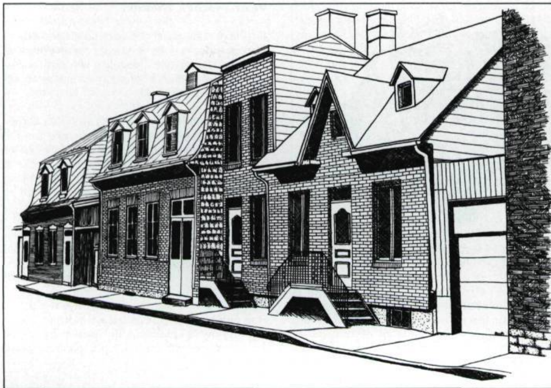
Maisons de la rue Saint-Olivier, près de la rue Racine. (Dessin: Sylvie Bouffard, 1985).