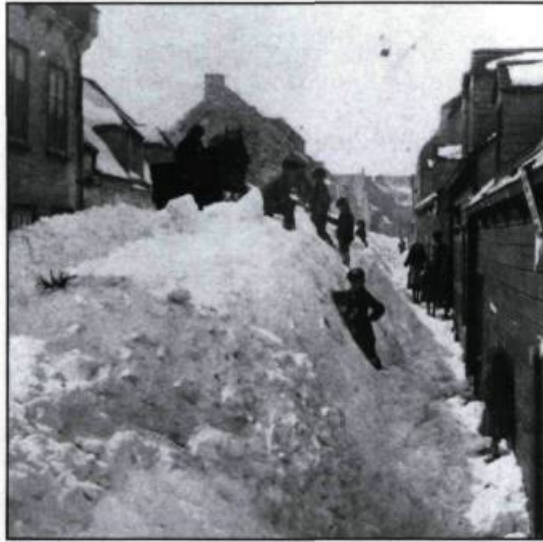
La rue Saint-Patrick sous la neige. (Photo: Louis-Prudent Vallée, 28 mars 1876, Archives du Séminaire de Québec, reproduction photographique: Pierre Soulard).

rats. Originant des écuries, cette vermine en arrivait à pénétrer dans les maisons. Il fallait presque toujours frapper aux portes des armoires avant de les ouvrir, si on voulait éviter qu'un rat ne nous file entre les jambes, chose qui se produisait de temps en temps et c'était alors une chasse organisée jusqu'à la capture du traître!