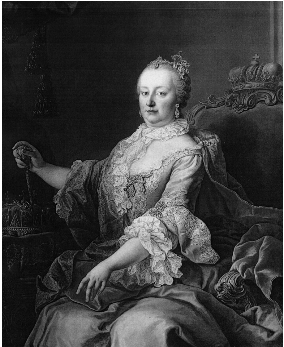
L'impératrice Marie-Thérèse d'Autriche (1717-1780); huile sur toile de Martin van Meytens, 1759, conservée à l'Académie des beaux-arts de Vienne.

Après un début prometteur, l'alliance franco-autrichienne connaît maints déboires. Annus mirabilis pour les uns, annus horribilis pour les autres, l'année 1759 décide du sort de la guerre, alors que, des deux côtés de la Manche, l'opinion publique se fait de plus en plus insistante en faveur de la paix. Les journaux et pamphlets s'indignent des coûts liés aux hostilités. Les problèmes politiques intérieurs minent également le gouvernement des deux royaumes. Accusé d'être un jouet entre les mains de Jeanne-Antoinette Poisson, marquise de Pompadour, sa maîtresse, Louis XV perd le respect de ses sujets et la monarchie de sa superbe. En Angleterre, la mort de George II, en octobre 1760, entraîne l'accession au trône d'un jeune monarque de 22 ans qui, dans une de ses premières déclarations publiques, fait référence à cette guerre « sanglante et onéreuse » qu'il espère voir se terminer le plus rapidement possible. Malgré ses victoires sur terre et sur mer, la Grande-Bretagne se présente ainsi aux négociations de paix dans