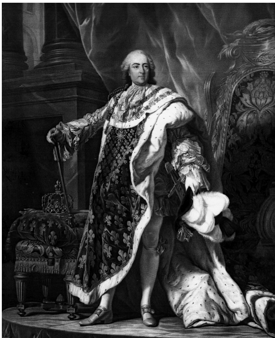
Louis XV, roi de France (1710-1774). Huile sur toile de Louis-Michel van Loo.

La fortune des armes est toutefois capricieuse. En novembre 1757, les troupes prussiennes écrasent les Français à Rossbach, en Saxe. Un mois plus tard, ce sont les Autrichiens qui sont battus à Leuthen, en Silésie. Les armées de Louis XV sont lentement mais sûrement repoussées hors du territoire allemand, alors que les Britanniques montent une offensive en Amérique du Nord. Louisbourg en 1758, Québec en 1759 et plusieurs îles des Antilles tombent entre leurs mains. Dans l'océan Indien, une tentative française de s'emparer de Madras échoue. Désireux de reprendre l'offensive, le gouvernement français prépare un plan d'invasion de la Grande-Bretagne, mais les navires