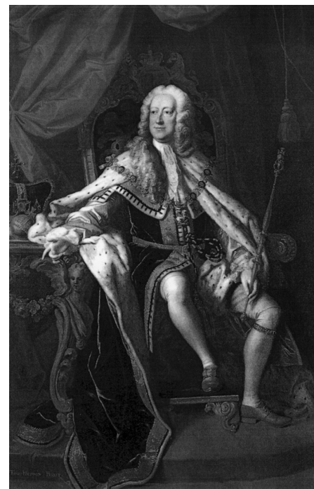
George II, roi de Grande-Bretagne, d'Irlande, etc. Huile sur toile par Thomas Hudson, 1744, conservée à la National Portrait Gallery de Londres.

les affaires européennes du temps. Par la suite, la fortune des différents États impliqués dans la guerre de Sept Ans sera évoquée. Nous terminerons en nous penchant sur l'échec de l'alliance austro-française qui force Paris à abandonner une grande partie de ses territoires coloniaux.