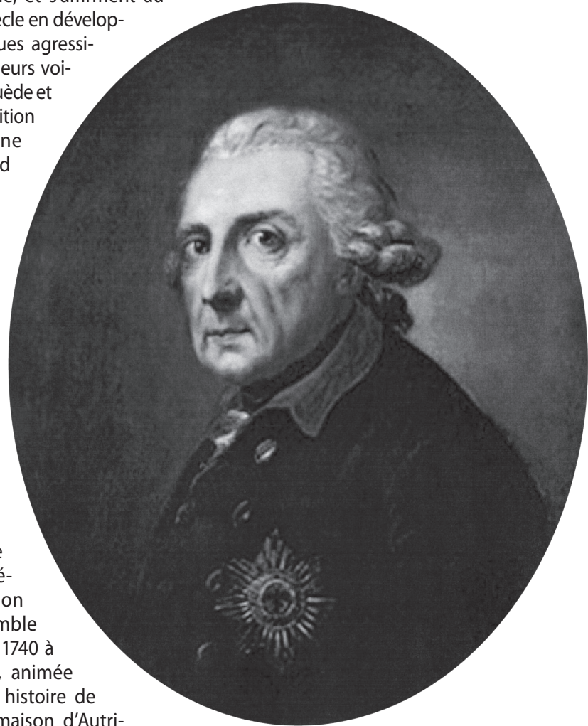
Frédéric II, roi de Prusse (1712-1786); huile sur toile d'Anton Raff, 1781. (Palais de Charlottenburg).

La fortune des armes se divise entre 1744 et 1748. La France s'empare de territoires importants aux dépens des Pays-Bas, traditionnellement protégés par la Grande-Bretagne depuis la fin du Moyen Âge, mais celle-ci réussit à enlever Louisbourg. La paix d'Aix-la-Chapelle rétablit la situation ante bellum , à l'exception de la Silésie que la Prusse peut conserver. L'équilibre européen est ainsi préservé, au grand désarroi des militaires sur le terrain qui ne comprennent pas pourquoi ils doivent abandonner leurs conquêtes. Ainsi, en 1748, le maréchal Maurice, comte de Saxe, qui s'est emparé d'une partie des Pays-Bas au nom du roi de France, ne peut qu'écrire à Jean-Frédéric Philypeaux, comte de