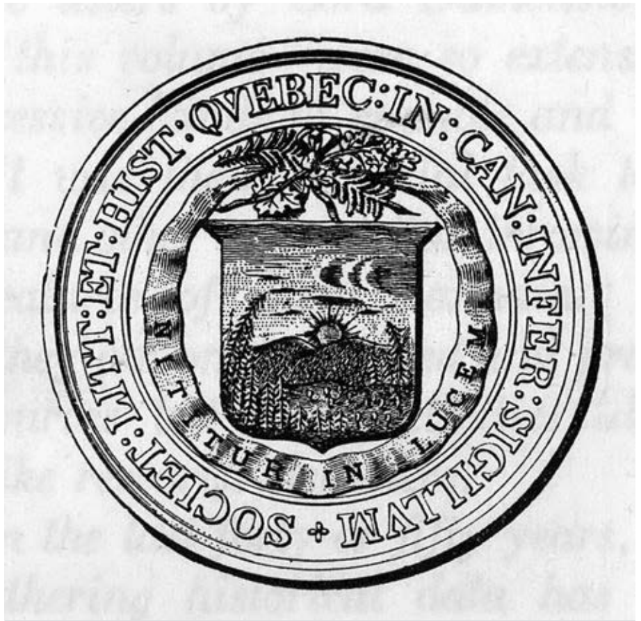
Sceau de la Société littéraire et historique de Québec. Fondée en 1824, la Société littéraire et historique de Québec a pour mission de recueillir, de conserver et d'éditer plusieurs documents historiques de la colonie. (Collection Assemblée nationale du Québec).

Le 12 décembre 1831, alors qu'en toile de fond se poursuit la crise des subsides, le député de Nicolet, Jean-Baptiste Proulx, propose qu'une somme « n'excédant pas trois cents livres courants, soit accordée à Sa Majesté, pour mettre la Société littéraire et historique de Québec en état d'obtenir et publier des documents historiques relatifs à l'histoire des temps reculés de cette province ». Cette résolution est suivie d'un projet de loi. Le « Bill pour approprier une certaine somme d'argent pour obtenir