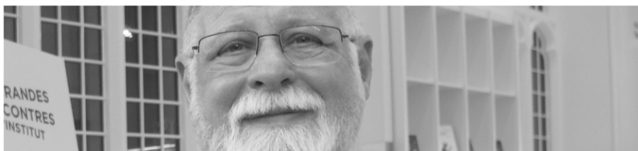
Alberto Manguel.