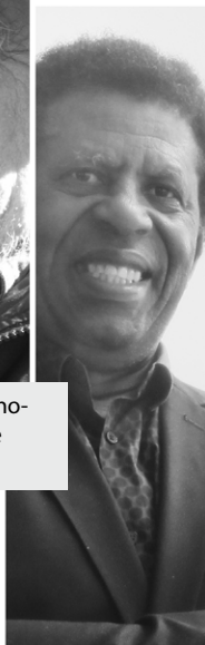
Dany Laferrière.