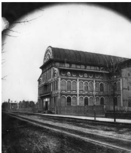
Palais de cristal de Montréal (1879-1896). Musée McCord, Montréal.