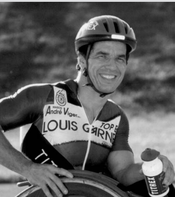
André Viger (1952-2006). En plus de ses succès à Boston, à Montréal et aux Jeux olympiques, André Viger a contribué à l'éclosion du sport paralympique au Canada.

Au tournant des années 1960-1970, la mode du jogging s'amorce aux États-Unis. Le Québec est également touché par cette nouvelle mode. À Boston, en 1971, les dirigeants du marathon établissent des standards afin de limiter les inscriptions. Ici, au Québec, le développement de l'athlétisme et la tenue des Jeux olympiques de 1976 ajoutent à la popularité croissante de la course à pied. Le nombre de Québécois présents à Boston progresse : en 1972, sur les 1 207 participants au marathon de Boston, 26 proviennent du Québec et en 1975, ils seront 28.