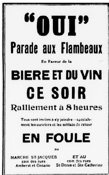
Affiche de la Parade des Oui avril 1919, La Presse .

Organisée par le Conseil central des métiers et du travail de Montréal et par des associations de vétérans, on la qualifie de « parade des ouvriers ». Près de 10 000 ouvriers et soldats démobilisés participent : dans le contexte des grèves et des revendications de l'après-guerre, on veut donner un caractère tempérant et ouvrier au rassemblement.