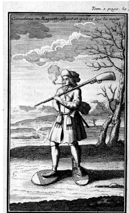
Canadien chaussé de raquettes et fumant la pipe. Illustration tirée de Claude-Charles Bacqueville de La Potherie, Voyage de l'Amérique : contenant ce qui s'est passé de plus remarquable dans l'Amérique septentrionale depuis 1534 jusqu'à présent , Amsterdam, Henry des Bordes, 1723, tome 1, p. 51.

En dépit de cette disponibilité locale, le tabac que préfèrent les habitants du Canada est celui qui vient d'ailleurs... On trouve deux catégories de tabac