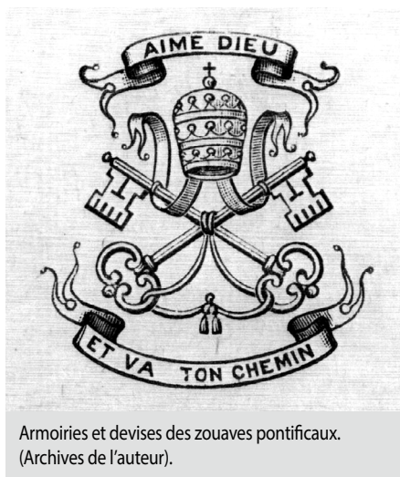
Armoiries et devises des zouaves pontificaux. (Archives de l'auteur).

Quand les zouaves reviennent au pays, en 1870, après s'être portés volontaires pour la défense des États pontificaux, des fonctionnaires de l'État provincial, les philanthropes et l'archevêché de Montréal croient trouver en eux les candidats parfaits pour jeter les fondements d'une véritable métropole régionale française et chrétienne. En récompense pour leurs actions que l'on dit courageuses (même s'ils ne se sont jamais battus), on offre à quelques-uns d'entre eux des lots de terre dans une paroisse baptisée en l'honneur du pape Pie IX. Au dire de certains, les zouaves canadiens, en associant le courage des militaires et