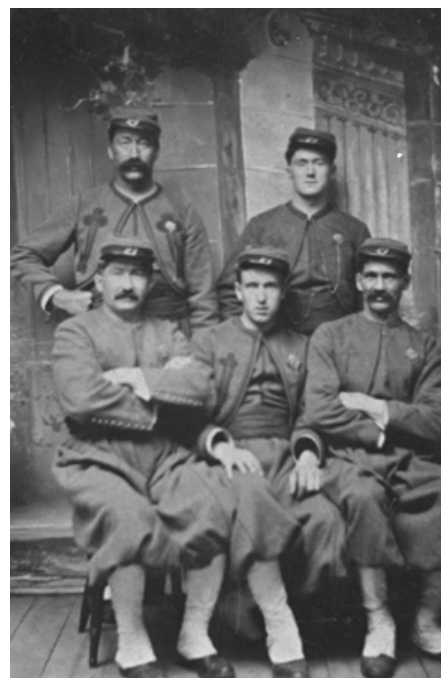
Groupe de zouaves, vers 1870. (Ferrotype).

Ce qui n'aide pas la cause des premiers habitants de Piopolis, c'est que les terres de l'endroit sont très rocheuses. En outre, les meilleurs emplacements agricoles ont été accaparés par des spéculateurs qui ont pris des lots près des cours d'eau et du lac, sans les occuper et sans les défricher – attendant simplement que les prix augmentent grâce au travail des colons pour les vendre. Les terres qui restent à donner se situent loin des routes, difficiles