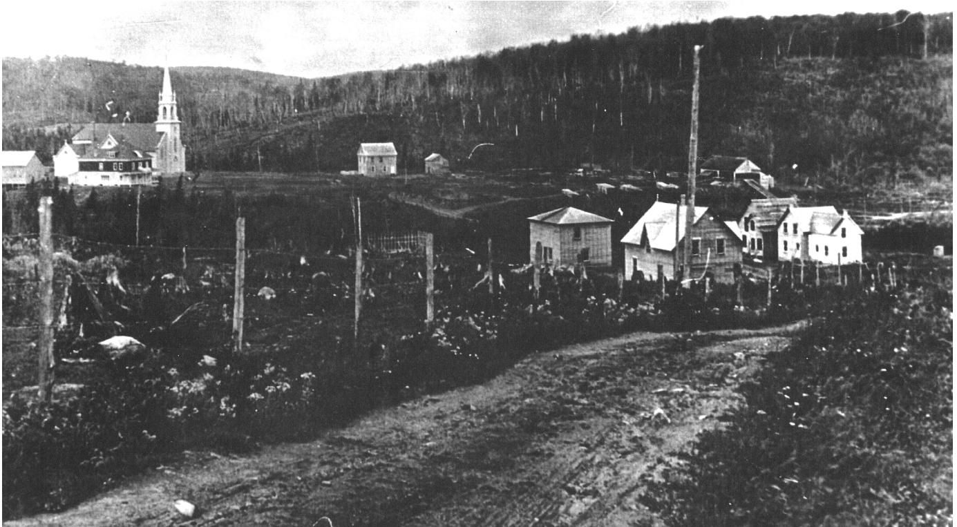
Village de Piopolis vers 1910.

ne viennent éteindre les flammes. Non, on ne peut pas dire que, dans le premier demi-siècle de son existence, le ciel était au beau fixe dans la « pieuse » colonie des zouaves pontificaux!