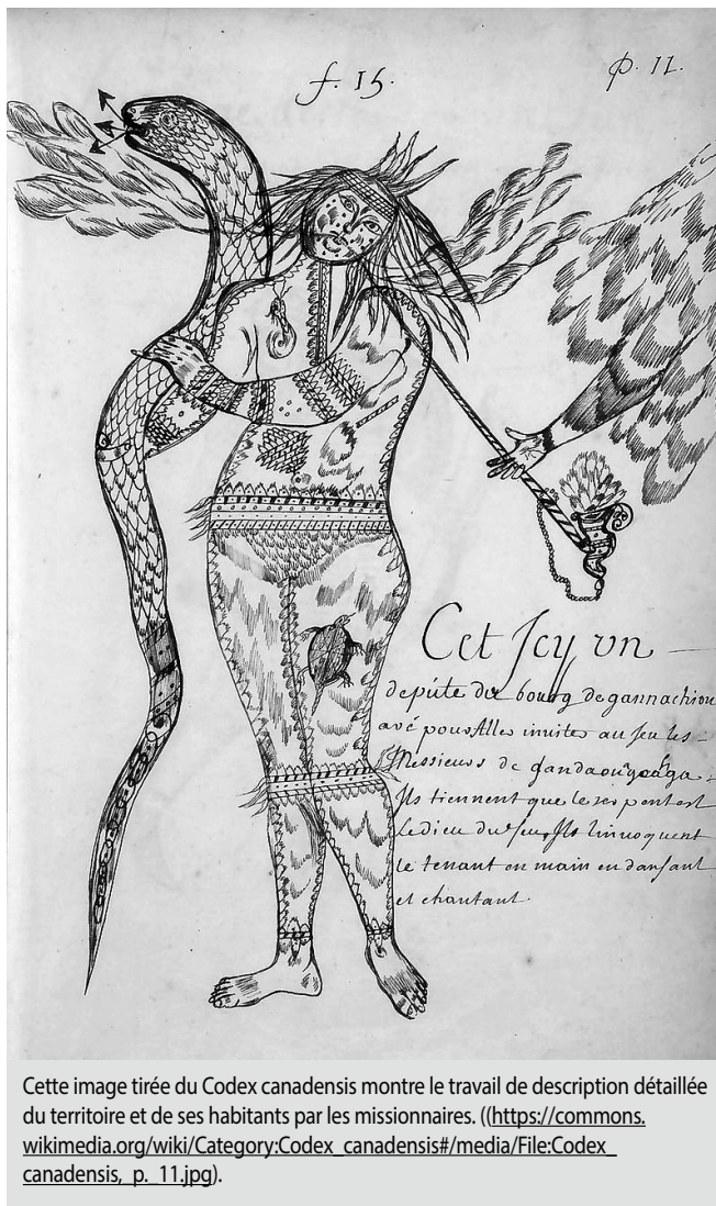
Cette image tirée du Codex canadensis montre le travail de description détaillée du territoire et de ses habitants par les missionnaires. ( https://commons.wikimedia.org/wiki/Category:Codex_canadensis#/media/File:Codex_canadensis_p_11.jpg ).

Au contraire, si plusieurs reconnaissent aujourd'hui les impacts dévastateurs de la colonisation pour les autochtones, l'histoire peut nous enseigner que ces impacts n'ont pas nécessairement été motivés par les pires intentions. Cette leçon devrait servir de mise en garde à une époque où les bonnes intentions