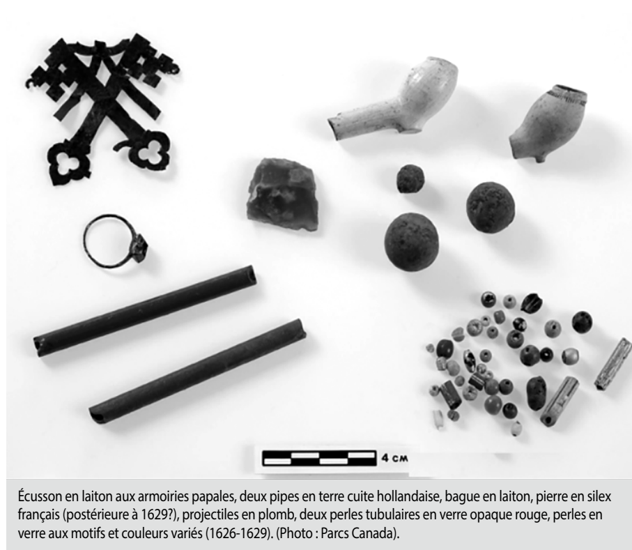
Écusson en laiton aux armoiries papales, deux pipes en terre cuite hollandaise, bague en laiton, pierre en silex français (postérieure à 1629?), projectiles en plomb, deux perles tubulaires en verre opaque rouge, perles en verre aux motifs et couleurs variés (1626-1629).

Plusieurs pipes en terre cuite et deux autres en pierre de facture amérindienne, des perles tombées de vêtements et de parures, ainsi que quelques pierres (chert) taillées selon les techniques utilisées par les Amérindiens, indiquent la présence de ces derniers dans le fort Saint-Louis. Ils sont probablement venus rencontrer le chef de la colonie française pour entretenir les