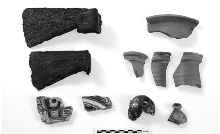
Hache espagnole, fragment d'un plat en terre cuite normande, coin à fendre, fragments de trois pots en grès normands, fragments d'un plat de service en majolique des Pays-Bas, fragments de deux bouteilles en verre (1626-1629).

Le bâtiment est conservé jusqu'en 1647 alors que le gouverneur Montmagny le fait raser pour construire le premier château Saint-Louis. Marie de l'Incarnation, en 1644, précise que ce logis est en pierre. Les niveaux archéologiques associés aux deux premiers forts ont livré d'autres indices reliés à ce bâtiment : présence de tuiles à toiture, de carreaux à plancher, de verre à vitre et de clous