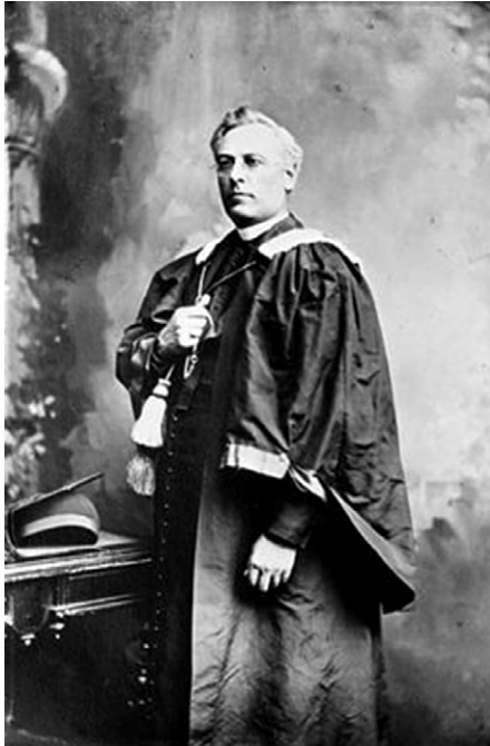
Henri-Raymond Casgrain. ( http://pistard.banq.qc.ca/unite_chercheurs/description_fonds?p_anqid=201710081530299735&p_centre=03Q&p_classe=P&p_fonds=560&p_numunide=895527 ).