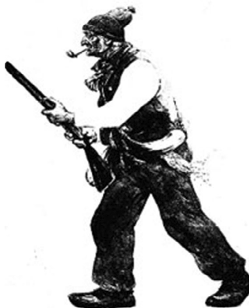
Un vieux de 1837 par Henri Julien. ( http://bibnum2.banq.qc.ca/bna/numtxt/172146.pdf ).

« Pussions-nous, un jour ou l'autre, reprendre ce que proposait l'idéal des Patriotes et reconstituer sur ses bases l'évangile national! [...] Les Patriotes nous ont indiqué la voi[e]. À nous [...] de parfaire l'œuvre que la fatalité leur a interdit de terminer, à nous d'accepter la leçon des Patriotes! » (Gérard Filteau, Histoire des patriotes ) Attentif aux mouvements d'émancipation nationale et coloniale autour du globe, le Québec tente depuis des décennies d'exprimer son identité sur un territoire qui lui est propre. Du slogan Maître chez nous en remontant vers des expressions beaucoup plus anciennes, la Révolution tranquille fait resurgir certains idéaux enfouis sous le duplisme. Il est alors possible pour les acteurs des années 60 de remettre au goût du jour un discours élaboré plus d'un siècle auparavant. Dans cet article, nous chercherons à analyser en particulier la manière dont les membres du Front de libération du Québec (FLQ) perçoivent la période patriote et en font la promotion. Pour ce faire, nous analyserons la construction du nationalisme des années 1960 en nous penchant sur la façon dont il tente de s'inscrire dans une