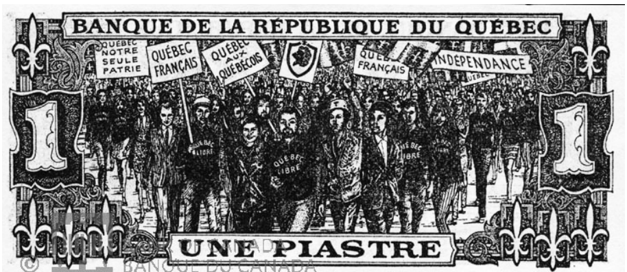
Piastre république du Québec. ( http://www.museedelabanqueducanada.ca/collection/artefact/afficher/1977.0088.00119.001/canada-les-chevaliers-de-lindependance-1-dollar-1970 ).