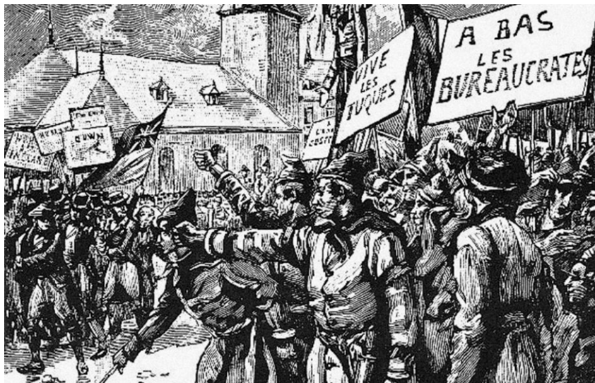
Affrontement Doric Club et Fils de la Liberté. ( http://lequebecunehistoiredefamille.com/capsule/de-lorimier/photo/affrontement-du-doric-club-contre-les-fils-de-la-liberte-en-1837 ).

le fait remarquer Louis Balthazar dans son étude sur le nationalisme au Québec, « C'est avant tout à la préservation d'une société d'ancien régime, dont les valeurs étaient incarnées dans des institutions comme le régime seigneurial et la coutume de Paris, que se sont attachées les élites canadiennes. » Les composantes de ce nationalisme naissant révèlent ainsi une attitude