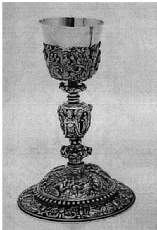
Trioullier Frères (attr.), calice et patène, vers 1900. Nicolas Dolin (maître 1648) pour la coupe du calice, entre 1648 et 1684. Calice dit de M gr de Laval , ruolz. (Musée de la civilisation, dépôt du Séminaire de Québec).