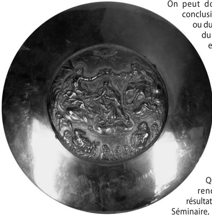
Trioullier Frères, vers 1900. Patène, ruolz. (Collection paroisse Saint-Ambroise-de-la-Jeune-Lorette).

du 17 e siècle. L'analyse a pour but de déterminer la composition de l'alliage, et ceci en rapport avec la date présumée d'exécution. [...]