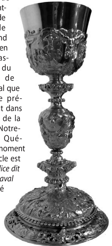
Trioullier Frères, vers 1900. Calice, ruolz. (Collection paroisse Saint- Ambroise-de-la-Jeune-Lorette).

« Le plus beau des calices de l'église Saint-Ambroise de Loretteville est un grand vase sacré en argent massif, copie du calice dit de M gr de Laval que l'on garde précieusement dans les voûtes de la basilique Notre-Dame de Québec ». Au moment où cet article est écrit, le Calice dit de M gr de Laval est exposé au Séminaire dans le Centre M gr de