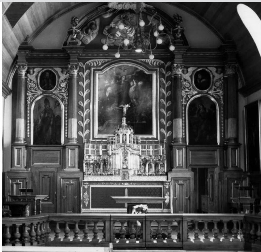
Retable de la chapelle de l'Hôpital Général de Québec. On y aperçoit Saint François adorant le crucifix en haut à droite. Photo Claude Payer, 1985 (détail).

Le Christ y porte la couronne d'épines dont les pointes acérées rendues bien visibles par le halo lumineux qui entoure sa tête nous font imaginer qu'elles la transpercent bien profondément, ce que laisse voir le sang qui s'écoule sur son front, ses yeux révulsés levés au ciel et ses larmes doublés de sang. Comme autre signe de dérision, il tient le roseau en guise de sceptre de l'une de ses mains liées, lui qui a répondu affirmativement à la question de Ponce Pilate : « Es-tu le roi des Juifs? ». Au-delà de la flagellation, le sang qui recouvre entièrement ses épaules a peut-être ici pour objet de remplacer le manteau de pourpre dont on l'avait revêtu. C'est alors la Vierge qui l'enveloppe de son propre vêtement tout en approchant ses lèvres des siennes. L'étoile blanche sur son manteau bleu – que l'on retrouve aussi sur une Mater dolorosa de l'artiste au Musée des beaux-arts de Tours – nous précise qu'il s'agit de la Vierge, la seule dans l'iconographie qui puisse s'approcher de la sorte de la tête du Christ.