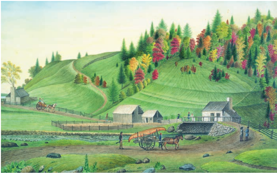
Vue du pont de la rivière du Sault-à-la-Puce, près de Québec, 1790. Aquarelle de Thomas Davies.

appuyés sur des caissons de bois et de pierre pour en allonger la portée. Ils inspirent aussi les écrivains. Ainsi, Philippe Aubert de Gaspé écrit, en 1863, dans Les Anciens Canadiens : « J'ai dit [...] que j'étais ami du progrès : je me rétracte. La civilisation a tué la poésie : il n'y en a plus que pour le voyageur. Belle prouesse, en effet, exploit bien glorieux que de passer sur un pont solide comme un roc, et assis confortablement dans une bonne voiture! » Et il ajoute, en parlant des constructeurs : « On a proclamé bien haut que ces messieurs avaient été les bienfaiteurs de leur pays! Bienfaiteurs, oui; mais, poètes, non. »