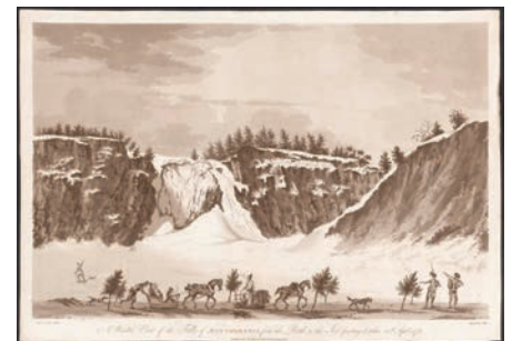
James Peachey. Traines et carrioles sur un chemin balisé, vers 1785. (BAC, C-013696).

Selon le règlement de 1706 du Conseil souverain, le grand voyer doit établir le tracé de concert avec les seigneurs, les officiers de milice, le juge, s'il y en a un, et « six des plus anciens et considérables habitants du lieu ». Le procès-verbal est homologué par l'intendant avant d'être lu et publié à la sortie de l'église le dimanche. Les capitaines de milice deviennent les principaux intermédiaires locaux de la voirie. Ils veillent à l'exécution des ordres du grand voyer, mais ils présentent aussi les doléances des habitants insatisfaits du tracé ou de la répartition des travaux. Le chemin doit avoir au moins 24 pieds français, soit 7,7 mètres de largeur, être le plus droit possible et ne pas être exposé à la crue des eaux. Si les terres sont déjà défrichées, les habitants labourent « à hullot », c'est-à-dire dans le sens du chemin en bombant le milieu, puis passent