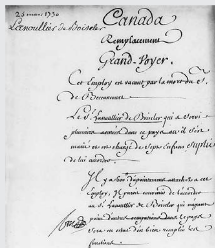
Document annonçant le salaire accordé au grand voyer Lanouillier de Boisclerc, en 1730.