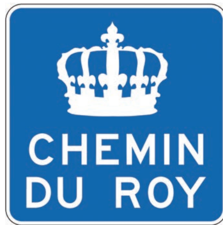
Panneau de signalisation routière de l'actuel chemin du Roy sur la rive nord du fleuve Saint-Laurent, entre Québec et Montréal.

La durée du trajet varie selon les arrêts. Il faut parfois attendre que le bac, mû par un câble, revienne de sa traversée précédente. D'autres haltes sont requises pour nourrir et reposer les chevaux. Pour se déplacer le plus rapidement possible, il faut changer de chevaux. L'inconfort des voitures et du chemin oblige aussi les voyageurs eux-mêmes à se reposer. Le parcours est donc ponctué de plus de