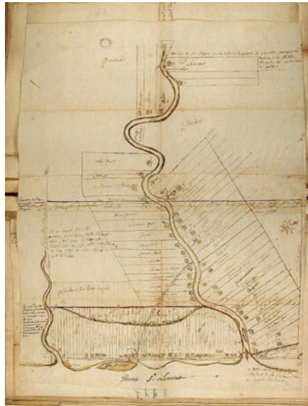
Plan cadastral de Batiscan, seigneurie des Jésuites, vers 1725. (France, CAOM, G1, 461).

Il est à noter que les autorités coloniales n'ont pas annoncé vouloir ouvrir un chemin royal. L'intendant ordonne plutôt le « rétablissement des chemins publics » des seigneuries. Cette approche lui permet d'obliger les habitants à céder la terre requise pour le chemin sans compensation et d'effectuer les travaux par corvée individuelle, comme le stipulent les actes de concession. La devanture étroite des terres variant très peu, cette pratique répartit les charges de manière relativement égale. Les fardeaux exceptionnels, tels que les sols de piètre qualité, les écarts par rapport à un tracé rectiligne, les ponceaux de plus de 4 pieds français, soit 1,3 mètre, ainsi que les ponts doivent toutefois être répartis