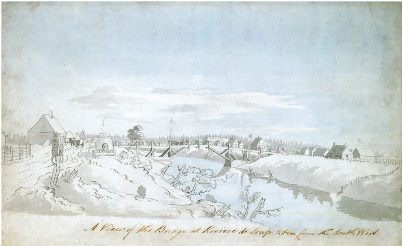
James Peachey. Le pont sur la rivière du Loup, vers 1785. (BAC, C-045560).