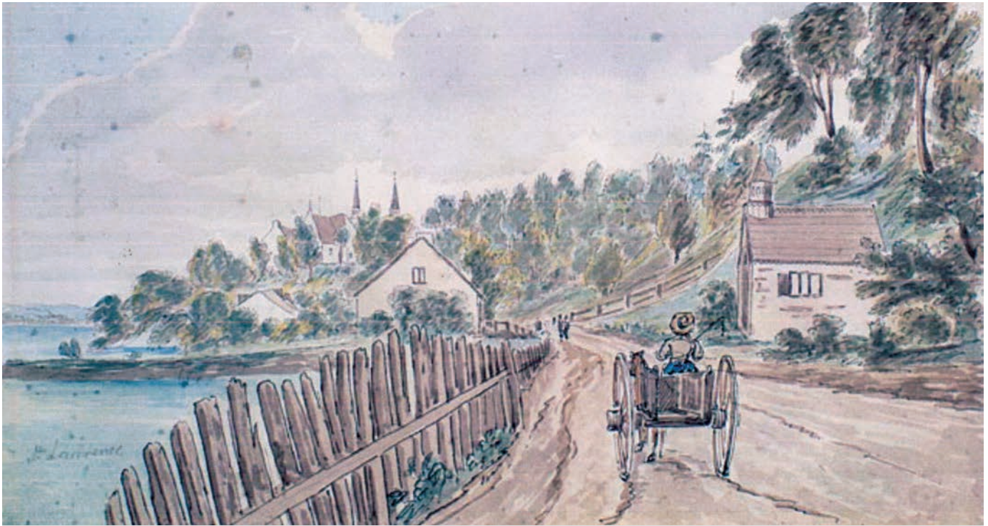
Le chemin du Roy à Château-Richer, Bas-Canda, 1829, © James Pattison Cockburn / Bibliothèque et Archives Canada / C-040026.

En général, les chemins ne sont pas recouverts de matériaux particuliers, d'où l'apparition d'ornières après les pluies et lors des dégels. Sous le Régime français, seuls quelques tronçons traversant des secteurs marécageux sont recouverts de rondins de bois. Le long du lac Saint-Pierre, les habitants doivent construire une levée en quelques endroits pour protéger le chemin de la crue des eaux.