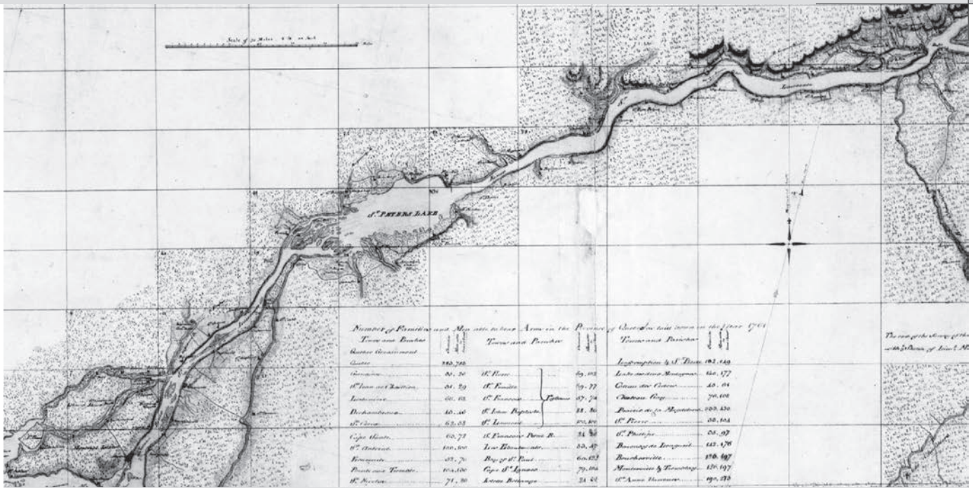
Le fleuve Saint-Laurent et le chemin du Roy entre Québec et Montréal, vers 1761. (BAC, NMC135042, carte dite de Murray).

20 relais distants d'environ 15 kilomètres. Ces étapes sont parfois dans des auberges, mais le plus souvent dans des maisons privées, au grand étonnement de certains voyageurs européens. Le confort des passagers varie selon les saisons. Une fois les ornières et les cahots du dégel aplanis par les corvées de la fin du printemps, les routes sont très empoussiérées pendant les sécheresses de l'été. Les pluies d'automne et l'instabilité des sols ouvrent de nouvelles ornières qui seront recouvertes par la neige. Les habitants doivent taper la portion de chemin qui passe devant leur terre avec leurs bêtes pour aplanir la surface et faciliter le passage. La neige recouvrant tout le paysage, les chemins doivent être balisés avec des repères de 6 pieds français (2 mètres) de hauteur plantés tous les 24 pieds français (7,8 mètres). L'hiver facilite aussi la traversée des rivières sur la glace et les traîneaux glissent plus facilement sur la neige que les calèches ne roulent sur la terre. À l'exception des périodes de tempêtes et de grands froids, de nombreux voyageurs préfèrent donc se déplacer par de belles journées d'hiver que pendant les autres saisons.