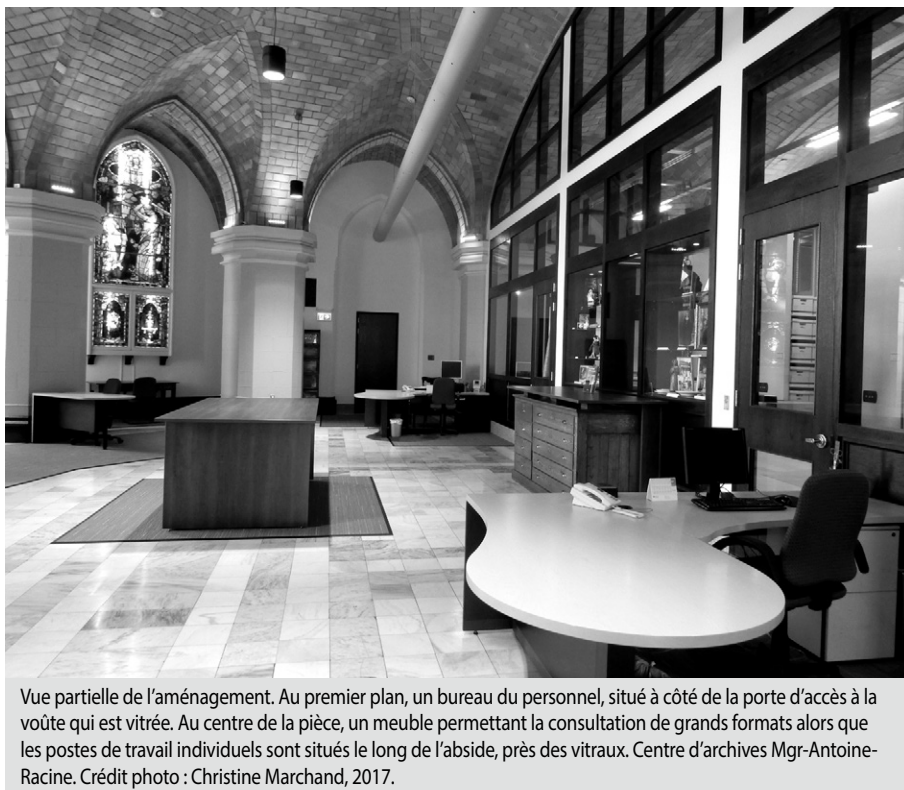
Vue partielle de l'aménagement. Au premier plan, un bureau du personnel, situé à côté de la porte d'accès à la voûte qui est vitrée. Au centre de la pièce, un meuble permettant la consultation de grands formats alors que les postes de travail individuels sont situés le long de l'abside, près des vitraux. Centre d'archives Mgr-Antoine-Racine.

tion. En établissant une plateforme d'échanges, le comité a permis de réunir avec des autorités ecclésiastiques, des archivistes du milieu et des spécialistes de diverses disciplines pour aborder des problématiques criantes.