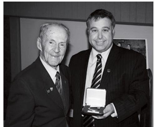
René Bureau recevant la médaille de l'Assemblée nationale des mains du député Sébastien Proulx.

Le naturaliste René Bureau s'est éteint en septembre dernier à l'âge vénérable de 101 ans. Cet autodidacte a consacré plus de 60 ans de sa vie à l'étude des sciences naturelles, surtout à la minéralogie et à la paléontologie. Il a notamment œuvré à la préservation des fossiles de Miguasha, en Gaspésie, site qui figure depuis 1999 sur la liste du patrimoine mondial de l'UNESCO. La communauté scientifique a reconnu la contribution de Bureau à la préservation de ce site en nommant deux espèces de la faune fossile de Miguasha en son honneur, le poisson Miguashaia bureaui (Schultze, 1973) et le scorpion Petaloscorpion bureaui Kjellesvig (Wearing, 1986). Après avoir été adjoint au musée du Département de géologie de l'Université Laval de 1940 à 1968, il en est devenu le conservateur jusqu'à sa retraite en 1979. Le musée est devenu le Musée de géologie René-Bureau en 2000. Au cours de son séjour de 39 ans à l'Université Laval, René Bureau a publié plus de 70 articles dans diverses revues. Ses intérêts ne se limitaient pas aux pierres et fossiles, mais s'étendaient aussi à l'histoire. Il a notamment rassemblé divers documents, photographies et objets témoignant de la vie à Québec, qui se retrouvent aujourd'hui aux Archives de la Ville de Québec ou de l'Université Laval. Il s'est également intéressé à la généalogie. Il est devenu en 1961 président et cofondateur de la Société de généalogie de Québec.