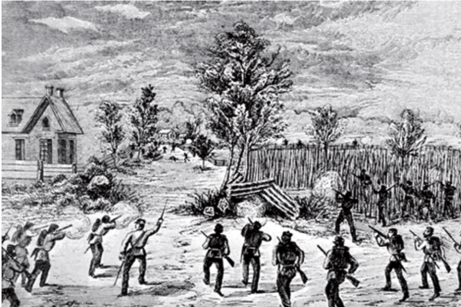
Cette gravure montre la bataille d'Eccles Mills opposant les fenians et le 50 e bataillon des Volontaires. ( https://en.wikipedia.org/wiki/Fenian_raids ).

la City, tels Thomas Baring et George Carr Glyn, lesquels suivaient de très près ce qui se passait au Canada. C'est que sur le plan économique, les liens entre ces colonies britanniques et la Grande-Bretagne étaient davantage financiers que commerciaux. Comme le montre Ged Martin, à peine 3 % des exportations britanniques étaient destinées aux colonies britanniques d'Amérique du Nord. En revanche, les capitaux investis par les banquiers et les financiers de la City dans la canalisation du Saint-Laurent et les projets d'infrastructures ferroviaires étaient énormes. Entre 1850 et 1859, le gouvernement du Canada aurait emprunté près de 100 millions de dollars. En 1866, 31 % des dépenses du budget du Canada était consacré au service de la dette – dette que l'on devait pour l'essentiel aux financiers britanniques. Ces mêmes financiers étaient également détenteurs d'obligations de nombreuses villes. Pour ces financiers, le lien impérial était primordial puisqu'il constituait une sorte de garantie que, tôt ou tard, ces prêts seraient honorés. Ces investissements étaient beaucoup plus sûrs que ceux consentis aux États américains dont certains, durant la crise éco-