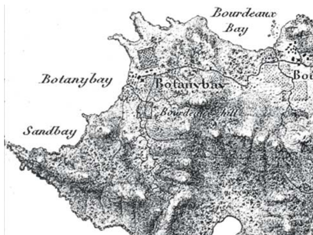
Botany Bay en Australie. Carte de l'établissement en 1834-1839. ( http://www.stjohnhistoricalsociety.org/Articles/BotanyBayEstate.htm ).

Dans un éditorial d'août 1839, de concert avec les pressions privées qu'exerçait depuis le début de la décennie la North American Colonial Association à Londres,