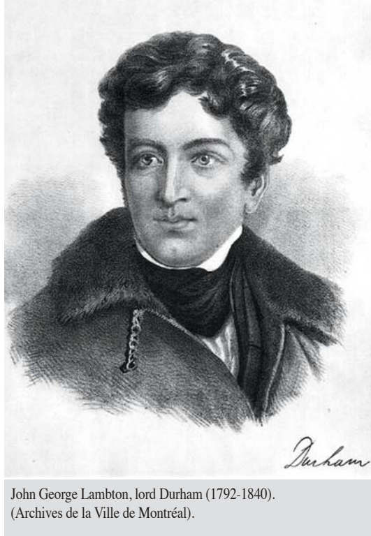
John George Lambton, lord Durham (1792-1840).

Les efforts avortés des tories en vue de criminaliser les insurgés patriotes de 1837 seront couronnés de succès en 1839 à la suite de l'échec de la deuxième insurrection. Étant « le plus noir et le plus ténébreux de tous les crimes politiques » ( Herald Abstract , 25 novembre 1837), la rébellion appelle ainsi, selon eux, une expiation collective. Aussi, en juillet 1839,