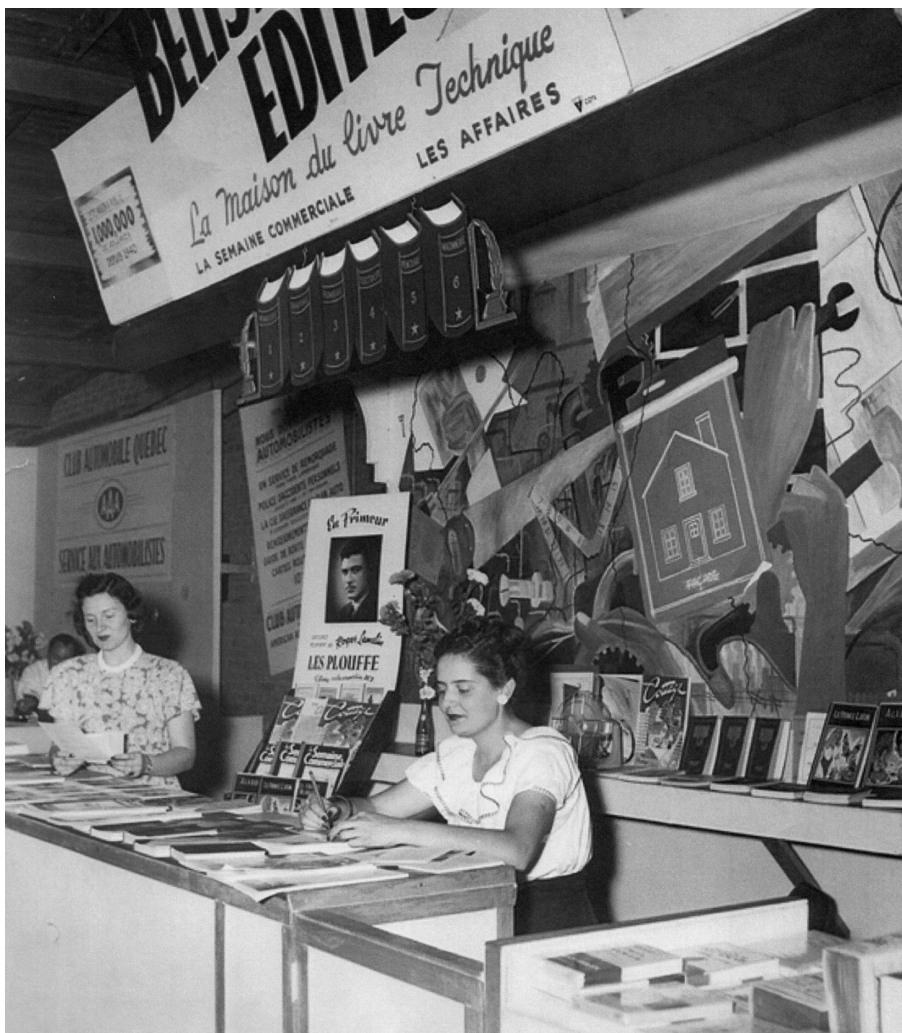
Le kiosque de Bélisle, éditeur, 1948. Photo : Studio Léo. E. Dery Reg'd. BAnQ, Centre d'archives de Québec, fonds Louis-Alexandre Bélisle. (P598, S44, D1, P80).

*Note : version remaniée d'un article à paraître dans Le Dictionnaire des gens du livre .