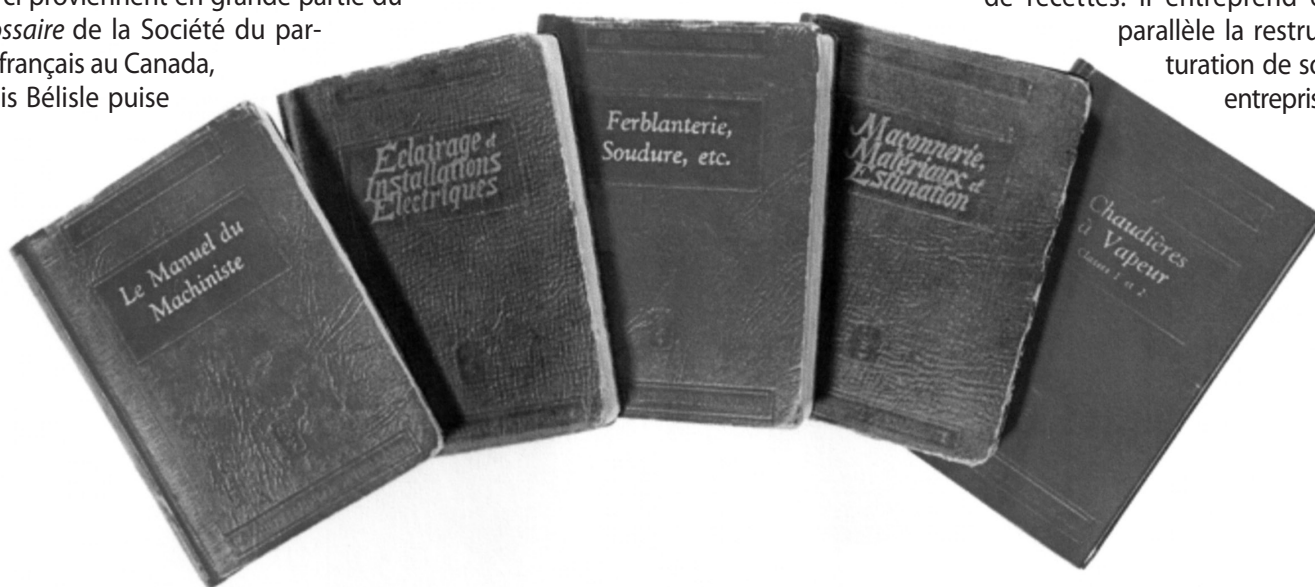
Les manuels de la série « Arts, métiers et technique » ont une couverture souple en carton de 1946 à 1950 et une couverture rigide en cuirette à partir de 1950. BAnQ, collections patrimoniales (621.183 H6361b F1954 - v.2).

du Conseil de la vie française en Amérique en 1971, Bélisle sera admis à la Société royale du Canada en 1974. Les années 1960 sont l'occasion, pour Bélisle, de diversifier sa production. Il fonde un club du livre, la « Bibliothèque des grands auteurs », adaptation québécoise de la collection « Great Books of the Western World », de Mortimer Adler, et supervise la traduction de livres de recettes. Il entreprend en parallèle la restructuration de son entreprise.