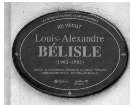
Épigraphie installée par la Ville de Québec au 801, avenue Murray. (La Cité-Limoilou) Québec.

reprise chez Beauchemin, puis aux Édition Aries. Une troisième édition grand format paraîtra en 1971, puis une dernière en 1979, chez Beauchemin. Le Dictionnaire rapportera à son auteur plusieurs honneurs : lauréat du Prix de la langue française de l'Académie française en 1958, puis de la médaille d'or