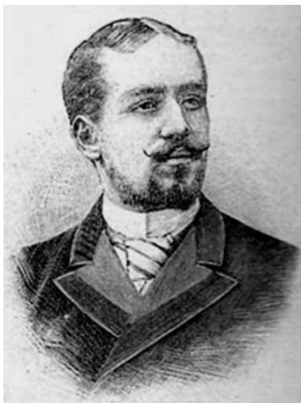
Le consul général de France à Montréal, Charles-Eudes Bonin, qui occupe ce poste de 1912 à 1918. C'est à lui qu'incombe, en août 1914, la responsabilité de la mobilisation des quelque 5 000 réservistes français du Canada. ( L'illustration , 27 février 1897).

Aussi, certains ressentent amèrement l'« abandon » par la France de ses colonies d'Amérique du Nord à la suite de la signature du traité de Paris, en 1763. Cette fracture historique aurait amené les Canadiens français à lutter pour leur survie